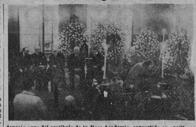
Aspecto ayer del vestíbulo de la Real Academia, convertido en capilla ardiente durante la permanencia del féretro que contiene los restos del poeta y académico don Manuel Machado.