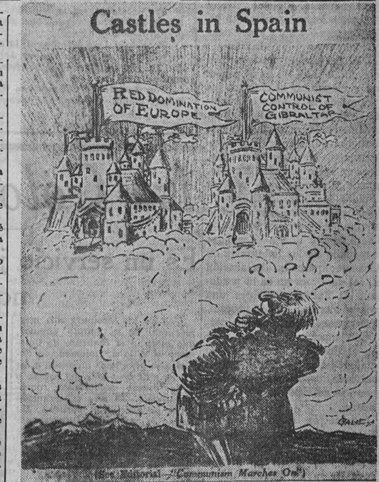
Los periódicos norteamericanos de la llamada cadena «Hearts» han publicado recientemente el artículo que sigue:

ni, se va haciendo más fuerte, mientras que las relaciones internas de los dos partidos de este bloque van cambiando en beneficio de los comunistas. El choque de estos acontecimientos en la Europa Occidental y Meridional no puede ser exagerado. Maurice Thorez y Ercoli Togliatti—esos viejos jefes del Komintern y discípulos formados de Stalin—, como jefes de sus países significarán la extensión del bloque soviético a las costas del Atlántico y del Mediterráneo y el aislamiento de Gran Bretaña. Las dos zonas occidentales de Alemania, oprimidas entre dos zonas comunistas, pronto caerán víctimas de sus vecinos. El Oriente Próximo sentirá inmediatamente la presión conjunta de las nuevas potencias soviéticas, Francia e Italia, y estarán en juego grandes transformaciones desde Grecia y Turquía, hasta el Irán. En los excelentes muelles y embarcaderos de Francia e Italia pronto serán lanzados nuevos navíos y pronto se constituirá una nueva y gran Marina francesa para defender el nuevo régimen contra los «imperialistas». Hay gentes que creen que el comunismo en acción en Occidente será menos terrorífico que en Yugoslavia y en Rusia. ¡Qué ilusión más peligrosa! Thorez no se ha pasado en vano años en Rusia, y las «deportaciones» sangrientas han sido ahora durante dos años la consigna de su partido. En Italia, los que se oponen al comunismo son tachados de fascistas, e incluso los jefes socialistas, con Pietro Nenni, figurarán