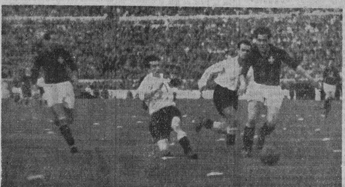
El delantero centro portugués, Peyroteo, ha logrado burlar a Nando y Curta, y con el balón en los pies se acerca a la meta española.

Y esto nos espera de no pensar seriamente que el fútbol es algo más que unas luchas domingueras entre dos equipos de provincias. Por eso nosotros, ante esta derrota de Portugal, repetimos nuestra combinación de cuando jugó el fútbol español, que no ha de perder características raciales, porque entonces no sería español, ha de iniciar inmediatamente otra época.