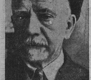
El ilustre novelista don Pío Baroja, cuyas «Obras completas» han empezado a publicarse.