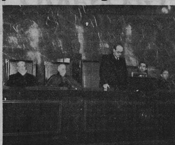
El Ministro de Educación Nacional, don José Ibáñez Martín, durante el discurso que pronunció en la inauguración del Pleno del Consejo Superior de Investigaciones Científicas.