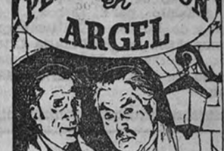
El más apasionante misterio policíaco alrededor de un trono TOLERADA MENORES