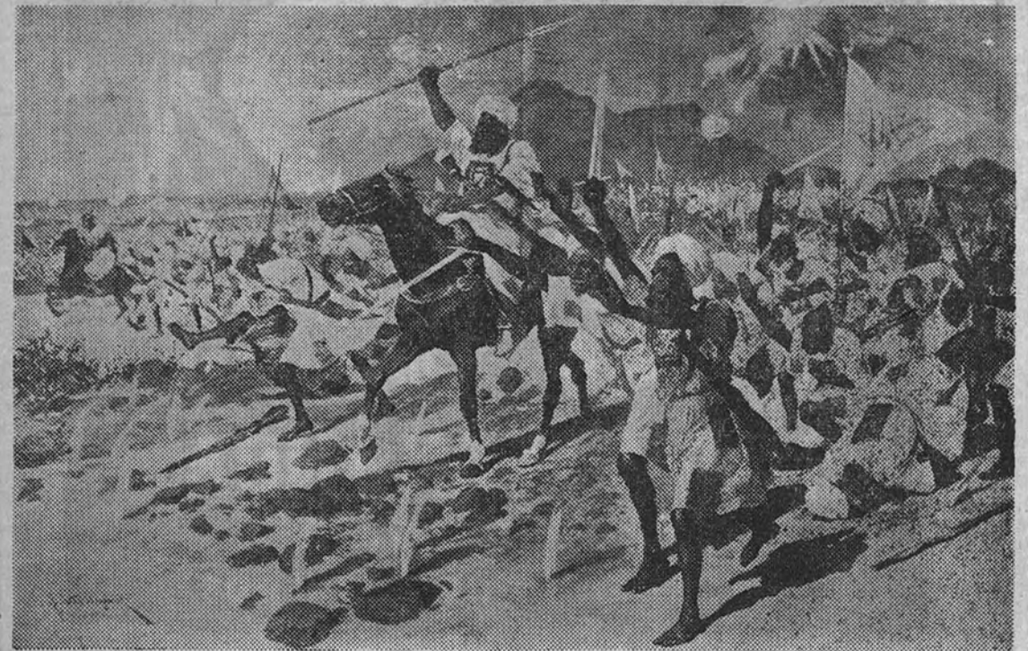
Tropas sudanesas, según grabado antiguo

Conquistado por los egipcios en 1822, fué ocupado por los mahadistas en 1885 y liberado por lord Kitchener en 1898