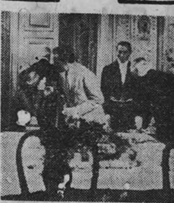
Momento escénico de la comedia "Pasarse de vivo", creación de Vittorio de Sica, que hoy se estrena en el cine Imperial.