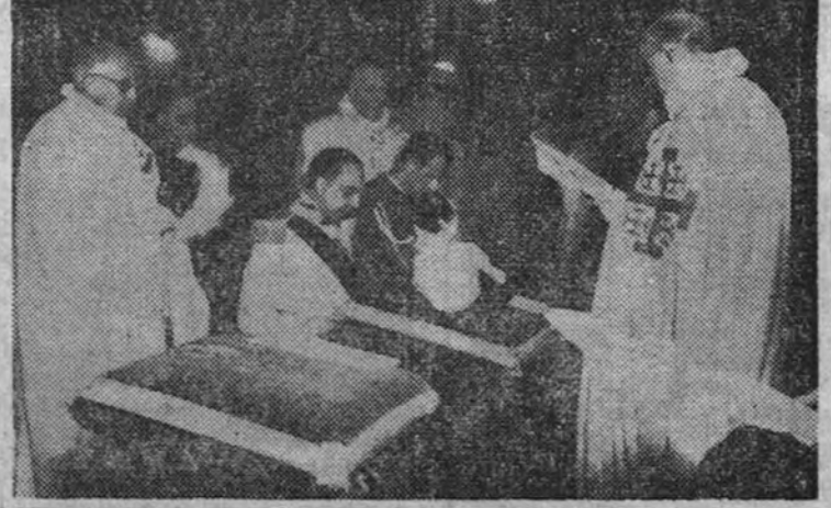
Los nuevos, cruzados de la Orden militar del Santo Sepulcro durante la solemne imposición de investiduras celebrada ayer en Madrid