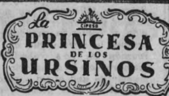
Ana Mariscal y José María Lado en "La Princesa de los Ursinos", película dirigida por Luis Lucia para Cifesa Producción.