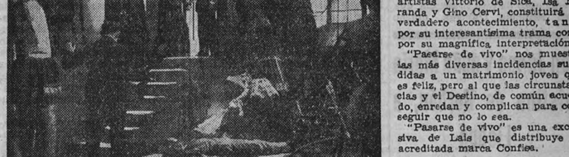
EN EL CINE IMPERIAL Hoy se estrena en el cine Imperial la originalísima superproducción italiana "Pasarse de vivo", que, interpretada por los célebres artistas Vittorio de Sica, Isa Miranda y Gino Cervi, constituirá un verdadero acontecimiento, tanto por su interesantísima trama como por su magnífica interpretación.

UNA PRODUCCION FILMOCEANO TOLERADA MENORES