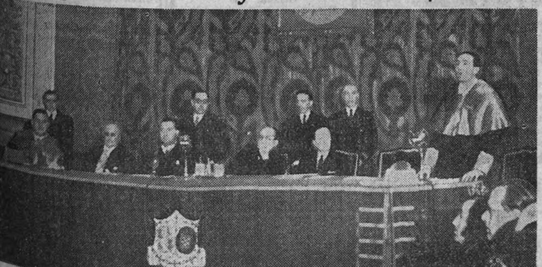
Presidencia del acto de inauguración de la cátedra «Ramiro de Maeztu», durante el discurso pronunciado por el director del Instituto de Cultura Hispánica