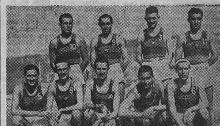
El equipo del Barcelona, que marcha en cabeza en el Campeonato de Liga de Primera División

El Barcelona, único equipo imbatido en Primera División