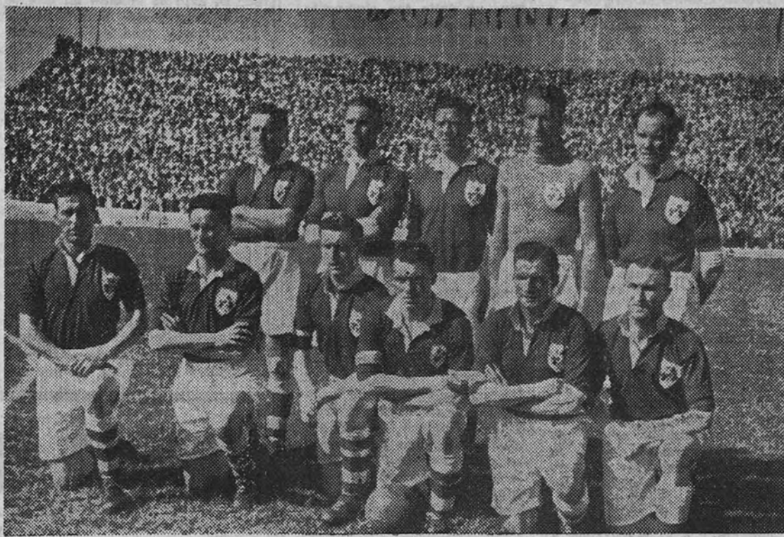
La selección de Irlanda que jugó en el Metropolitano con la selección española

Aun no está terminado el plan a seguir. Falta algunos detalles. Ayer el señor Cabot nos dijo que era acuerdo de la Federación no hacer manifestaciones hasta después de jugar el partido con Irlanda. Quiere responder con hechos más que con promesas. Pero hemos podido entender que, en principio, se desistirá de la formación de un equipo nacional fijo. Se piensa que este conjunto encontraría muchas dificultades para su formación y para celebrar partidos que favorezcan su perfeccionamiento. En este aspecto nos reservamos nuestra opinión particular. Se piensa adoptar un sistema concreto. Después de los resultados obtenidos por el San Lorenzo de Almagro parece lo más aconsejable que nuestros equipos traten de imitar a los argentinos en estos puntos fundamentales: Que los jugadores lleguen a un mayor dominio del balón. Que su preparación física esté más cuidada, y para descargar al entrenador de esta función, en la que suele guiarse por viejas experiencias, cuente con el auxilio de un profesor de cultura física. Que también conviene la colaboración de un médico, que lleve un fichero metódico de cada jugador y dictamine lo que más convenga en cada caso. Que el sistema de utilizar el ba-