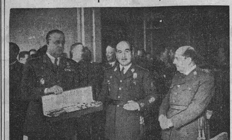
Un momento del acto de la entrega del fajín e insignias de teniente general al general García Valiño.

Presidió el Ministro del Ejército que le impuso el fajín