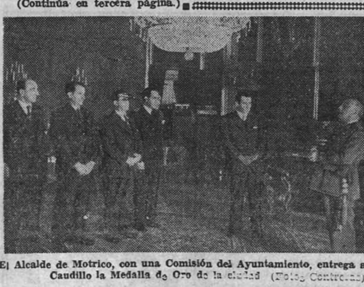
El Alcalde de Motrico, con una Comisión del Ayuntamiento, entrega al Caudillo la Medalla de Oro de la ciudad