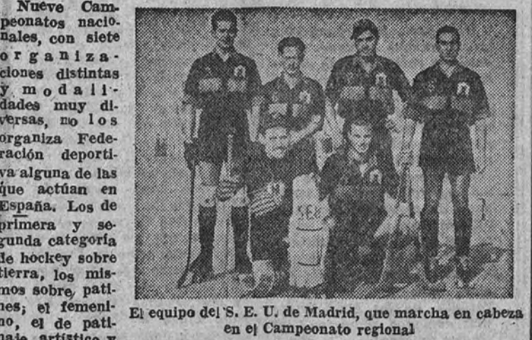
El equipo del S. E. U. de Madrid, que marcha en cabeza en el Campeonato regional

También habrá encuentros internacionales en casi todas las especialidades