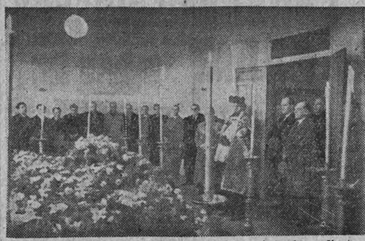
El ministro de Cuba, con otras personalidades, en la capilla ardiente, en el momento de ser sacados los cadáveres para darles sepultura en el cementerio de la Almudena.

Los cubanos recibieron sepultura en la Almudena y el norteamericano en el cementerio británico