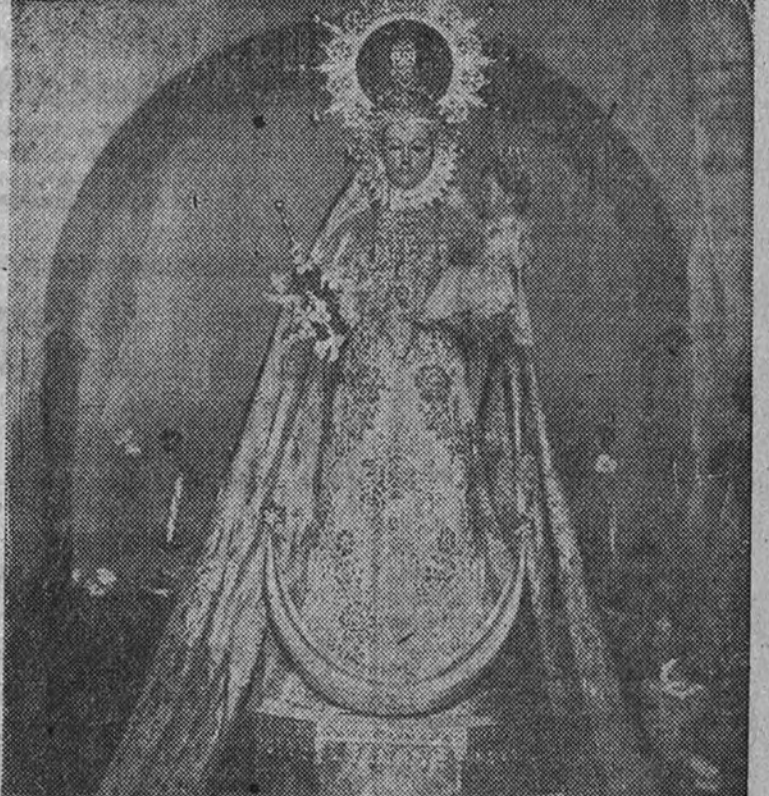
Nuestra Señora de la Fuensanta, Patrona de Alcaudete

Alcaudete es una importante población de la provincia de Jaén que cuenta con más de veinte mil habitantes. Su situación es verdaderamente estratégica, ya que constituye un paso obligado para las comunicaciones entre las provincias de Jaén, Málaga y Córdoba. Dispone de varias carreteras y caminos vecinales, y de la línea ferroviaria de Linares a Puente Genil. Alcaudete está enclavado en las proximidades de los cerros de Santo Antonio, Pedrera y Torre Maestra, entre los que se extiende su rico término municipal. Su excelente situación es la que determinó en los pasados tiempos el preponderante papel desempeñado por la ciudad en la guerra de la Reconquista. Alcaudete tuvo que soportar sitios de los moriscos, en sus cercanías se rifaron duras batallas, y la población fue el punto de reunión del Ejército cristiano, que desde allí partió para la conquista de Granada. Todavía conserva la ruina de un castillo árabe, ejemplo vivo de este pasado histórico.