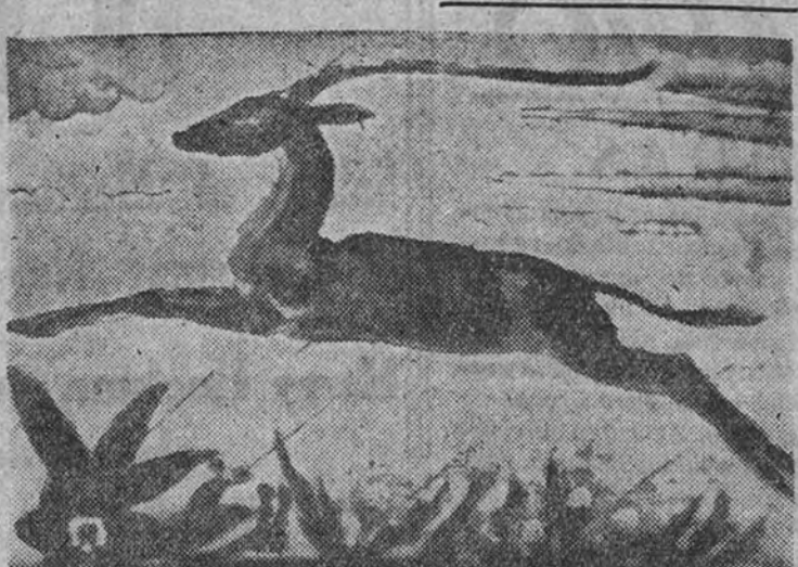
Una de las obras que figura en la Exposición

El Museo Nacional de Arte Moderno presenta en su salón de Exposiciones la obra de los esmalteristas Lombera y Alvarez, dando una prueba más de su entusiasmo por dar a conocer el esfuerzo de los artistas decoradores contemporáneos, especialmente de los cultivadores de las artes del fuego.