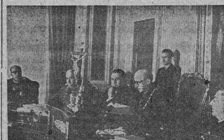
El presidente del Consejo de Estado, don Eduardo Calleja, con los Ministros de Asuntos Exteriores, Obras Públicas e Industria y Comercio, que presidieron la toma de posesión del nuevo consejero de Estado señor Lapuerta.

Asistieron al acto los Ministros de Asuntos Exteriores, Obras Públicas e Industria y Comercio