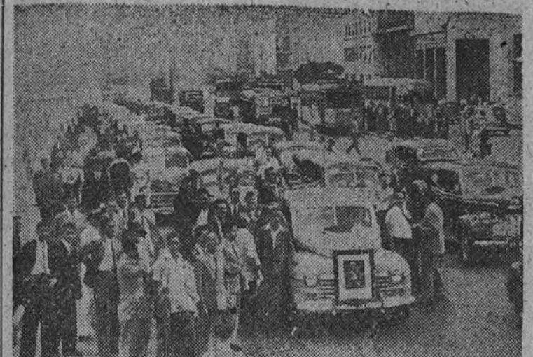
Aspecto de la manifestación organizada por los taxistas de Buenos Aires, para agradecer a Perón la solución de su conflicto con los patronos.