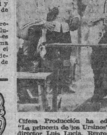
Espectaculares escenas, jamás vistas en la pantalla TOLERADA MENORES