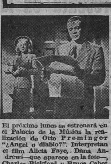
El próximo lunes se estrenará en el Palacio de la Música la realización de Otto Preminger "¿Ángel o diablo?". Interpretan el film Alicia Faye, Dana Andrews—que aparece en la foto—, Charles Bickford y Bruce Cabot.

CRIMEN o SUICIDIO? PAUL KELLY VIRGINIA GREY DON DOUGLAS Director: JOHN ENGLISH ASESINADO POR UN CADAVER. ¿QUE EXTRAÑO PODER HIZO QUE UN HOMBRE MUERTO TOMARA VENGANZA EN SU PROPIO ASESINO? VEA: CRIMEN o SUICIDIO? Y VERA LA MAS ESCALOFRIANTE PELÍCULA DEL AÑO. Complementa el programa el estreno riguroso en España del maravilloso dibujo en color de Walt Disney "EL RIVAL DE MICKEY" TOLERADA MENORES