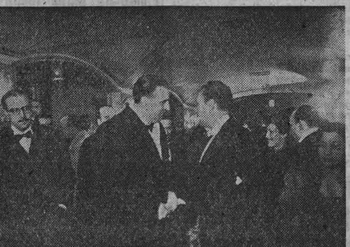
El Ministro de Asuntos Exteriores conversa con el director general de Propaganda durante el intermedio.