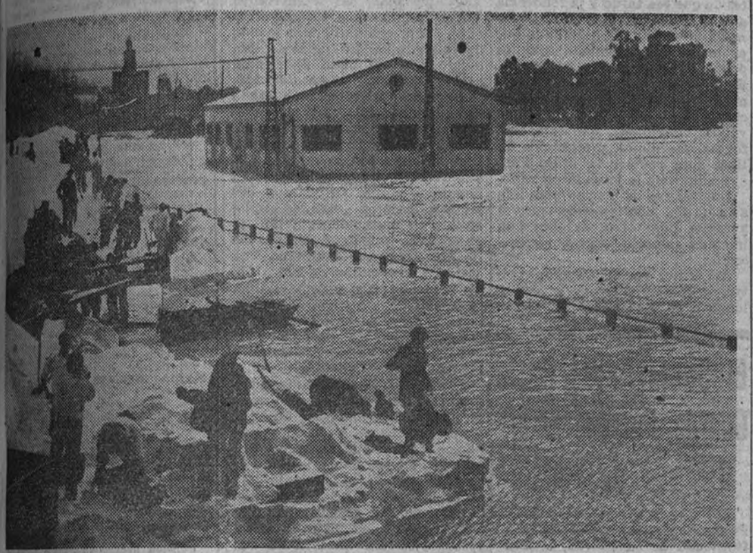
Debido a las últimas lluvias el caudal del río Guadalquivir ha aumentado de manera tan considerable que ha provocado inundaciones. A su paso por Sevilla las aguas han rebasado el puerto, tal como puede observarse en la presente fotografía.

El tráfico ferroviario y por carretera ha quedado interceptado en algunas provincias