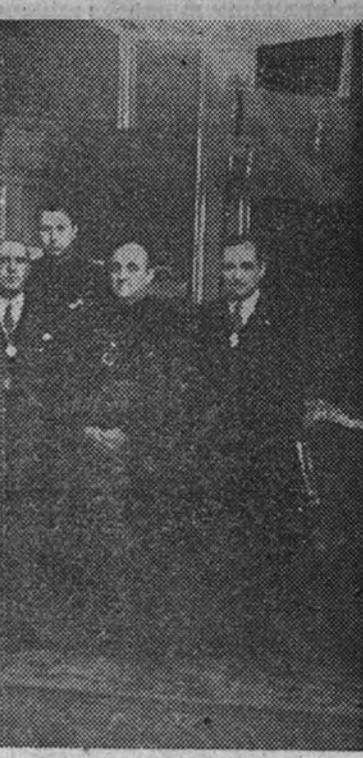
Su Excelencia el Jefe del Estado con el Presidente y miembros de la Comisión Gestora de la Diputación de Madrid, que ayer acudieron a cumplimentarle en el Palacio de El Pardo. (Información en segunda página.)