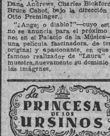
Cifesa Producción ha editado "La princesa de los Ursinos", del director Luis Lucia. Reproducción de un fotograma de esta película, en la que actúan como protagonistas Ana Mariscal y Roberto Rey