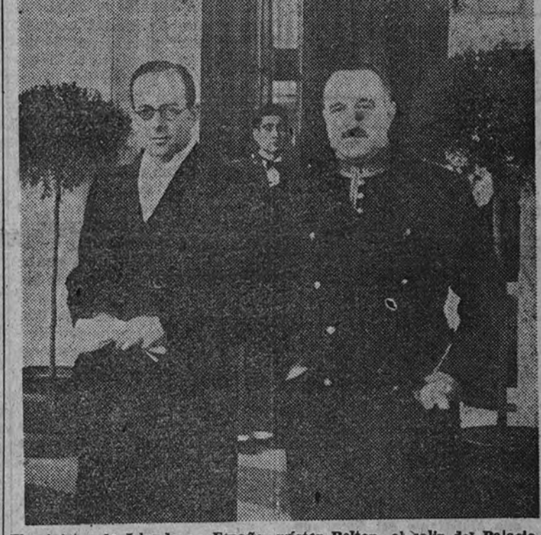
El ministro de Irlanda en España, mister Belton, al salir del Palacio de El Pardo después de presentar sus cartas credenciales a Su Excelencia el jefe del Estado.

En la mañana de ayer, y con el ceremonial acostumbrado, se efectuó en el Palacio de El Pardo la presentación de cartas credenciales a Su Excelencia el jefe del Estado del embajador extraordinario y ministro plenipotenciario de Irlanda en España, excelentísimo señor don John A. Belton.