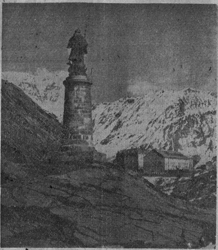
El convento de los monjes, en el Gran San Bernardo

La perforación de este nuevo paso a través del ancho macizo