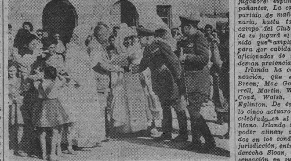
El director general de Marruecos y Colonias llega a Sidi Ifni y saluda a las autoridades españolas e indígenas