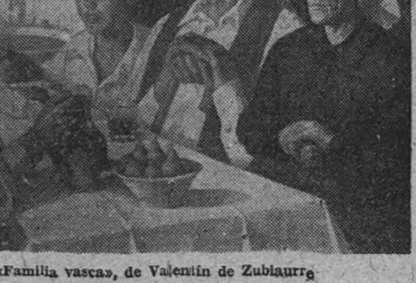
Familia vasca, de Valentín de Zubiaurre

Novedad del mayor interés es que, después de la representación de dicha obra, desfilarán por el escenario del Calderón las principales artistas de vengo que actúan en Madrid y que han estrenado o incorporado en otras ocasiones personajes de teatro benaventiano para interpretar escenas de sus obras más populares. De este modo, la fiesta que se prepara y a cerca de la cual daremos en nuestro número próximo más detalles—tendrá un carácter de íntegra dedicación a la genial y extraordinaria producción escénica del autor de