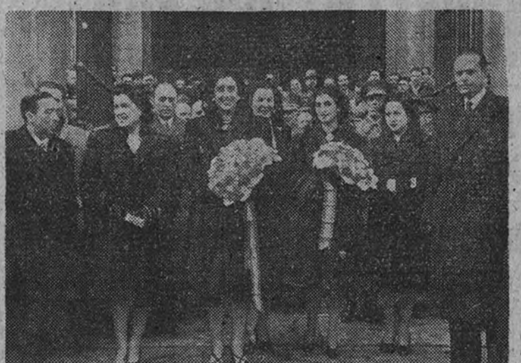
La esposa e hija de Su Excelencia el Jefe del Estado, con el Ministro de la Gobernación, director general de Seguridad y otras personalidades, al salir de la función religiosa en honor del Santo Ángel de la Guarda

El Ministro de la Gobernación inaugura el nuevo cuartel de la Policía de Tráfico de la Dehesa de la Villa