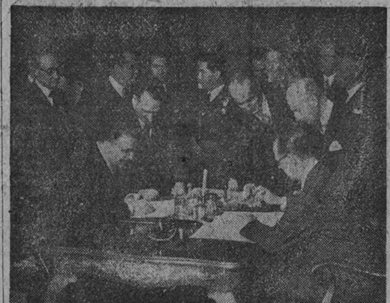
El Ministro de Asuntos Exteriores, señor Martín Artaño, con el embajador de la República Argentina, doctor Radio, en el momento de firmar el acuerdo aéreo hispanoamericano. (Información en cuarta página.)

—Sólo han tenido ustedes bastones? —Tuvimos guantes para hombres, algunas temporadas, y cajas inglesas de juegos. Casi siempre, hemos exhibido algunas boquillas o pipas de ámbar y espuma, para coleccionistas. Suelo tener en el escaparate una enorme, en la que nadie fumará jamás cigarros habanos. Lleva un grupo, muy bien esculpido, con las figuras de Andrómeda, Perseo y el monstruo, sobre rizados de olas. El motivo se sacó de Ce-