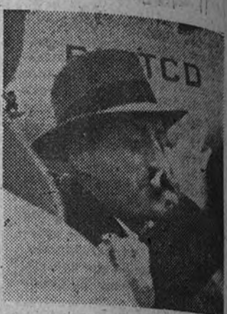
El seleccionador nacional a su llegada a Madrid