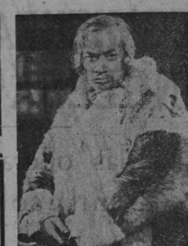
En el Imperial sigue exhibiéndose con creciente éxito el interesantísimo film "El bastardo"

Imperial EXTRAORDINARIO Y APOTEOSICO EXITO EXCLUSIVA ESPAÑA ACTUALIZADA DISTRIBUCION PUIGVERT