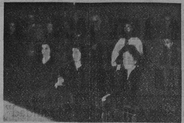
La esposa y la hija del Caudillo orando ante el Cristo de Medinaceli

Muchos millares de fieles y entre ellos numerosas personalidades adoraron la venerada imagen