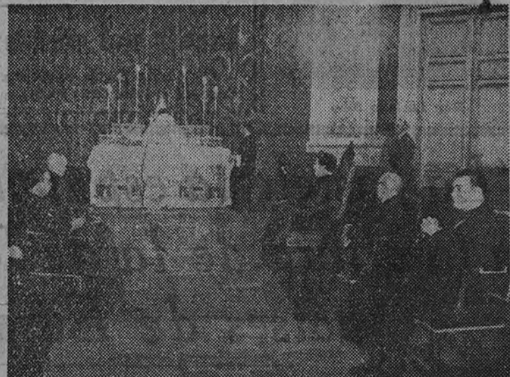
El rector de la Universidad con el director general de Bellas Artes y las restantes personalidades que presidieron la misa celebrada ayer con motivo de la festividad de Santo Tomás de Aquino.

MISA EN EL INSTITUTO DE CARTAGENA CARTAGENA 7.—La fiesta de Santo Tomás se ha conmemorado con una misa en la capilla del Instituto, que presidió el director con todos los catedráticos. (Cifra.) ACTOS ORGANIZADOS POR EL S. E. U. EN BARCELONA BARCELONA 7.—Con motivo de la festividad de Santo Tomás de Aquino, se han celebrado diversos actos organizados por el Sindicato Español Universitario. En la Universidad hubo una misa, a la que asistieron las autoridades y numerosos estudiantes. El rector de la Universidad ha enviado un telegrama al Ministro de Educación Nacional, felicitándole en nombre propio, en el de los catedráticos y en el de los alumnos de las distintas disciplinas. (Cifra.) DIVERSOS ACTOS EN HONOR DE SANTO TOMAS EN ZARAGOZA ZARAGOZA 7.—Se han celebrado diversos actos en honor de Santo Tomás de Aquino, Patrón de la Universidad española. En la Iglesia del Real Seminario de San Carlos hubo una misa de comunión, organizada por el S. E. U., con la colaboración de los Colegios Mayores. Secretario Diocesano de Acción Católica y Real Congregación de San Luis Gonzaga. Asistieron el rector, Alcalde, numerosos catedráticos y estudiantes. Más tarde, a las once,