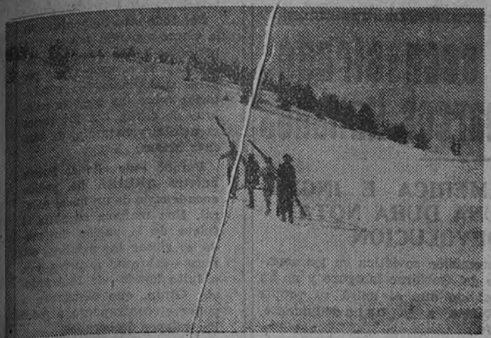
Las pistas de La Molina, donde se celebrarán los Campeonatos nacionales de esquí durante la semana próxima

En el equipo castellano faltan algunas figuras tradicionales