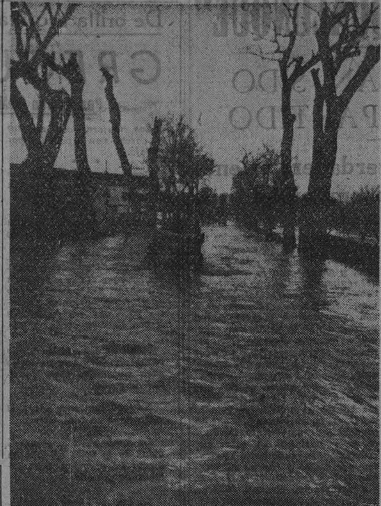
Vista de la vega de Aranjuez inundada por las aguas desbordadas del Tago. Las aguas cubrieron la carretera, haciendo imposible el paso de vehículos.

PELOTA. —A las diez de la mañana, en el frontón Recoletos, partidos de pala correspondientes a los Campeonatos de Castilla de aficionados. A las diez y cuarto de la mañana, en el frontón Madrid, partidos de pala correspondientes a los Campeonatos de Castilla de aficionados en la modalidad de pala corta. A las once de la mañana, en el frontón de la Pelota Castellana, partidos a mano de los Campeonatos de Castilla de aficionados. RIÑA DE GALLOS. —A las doce, en el Circolo Gallista de Madrid (calle de San José, 7). RUGBY. —En la Ciudad Universitaria, partidos del Torneo provincial universitario: A las diez, Arquitectura (B)-Derecho (B); a las once y cuarto, Medicina Agrícola (primera categoría); a las doce y media, Ciencias-Arquitectura (primera categoría).