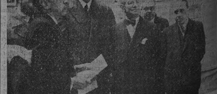
El Ministro de Asuntos Exteriores, con las personalidades que asistieron ayer a la inauguración de la interesante Exposición de fotografías que recogen las huellas de España en los Estados Unidos

En doscientas fotografías se recoge la huella de España en Estados Unidos