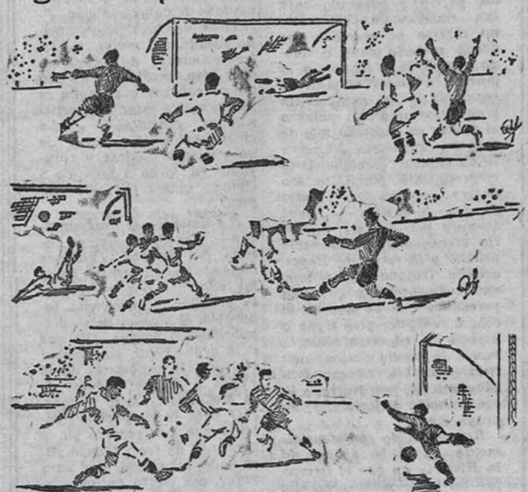
Pallás cruza el balón, que el portero del Madrid no puede despejar por rebote en el palo.—Corona intenta despejar, pero la pelota entra por alto.—Alta consigue el gol del Sabadell.

En una palabra, al Madrid como antes en este mismo campo al Atlético, le desbordaron por rapidez.