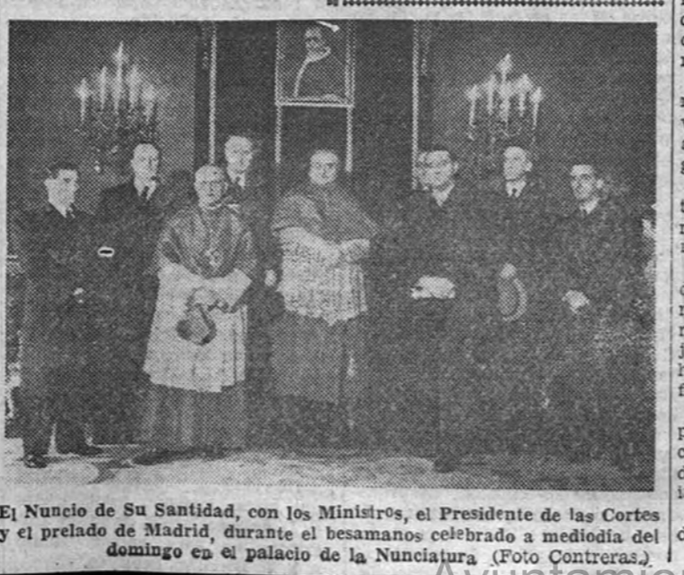
El Nuncio de Su Santidad, con los Ministros, el Presidente de las Cortes y el prelado de Madrid, durante el besamano celebrado a mediodía del domingo en el palacio de la Nunciatura.

A las once de la mañana, en la catedral de San Isidro, se celebró una misa, a la que asistieron el Gobierno y otras representaciones oficiales. A la puerta del templo esperaron al Nuncio de Su Santidad, monseñor Cioognani, el Ayuntamiento y la Diputación Provincial en corporación y bajo mazas, con el Alcalde, conde de Santa Marta de Babio, y el Presidente de la Diputación, marqués de la Valdivia; otras autoridades, Acción Católica, y sus cuatro ramas, con sus banderas; Seminario Conciliar de Madrid, cabecera de la diócesis, jóvenes de Acción Católica, etc.