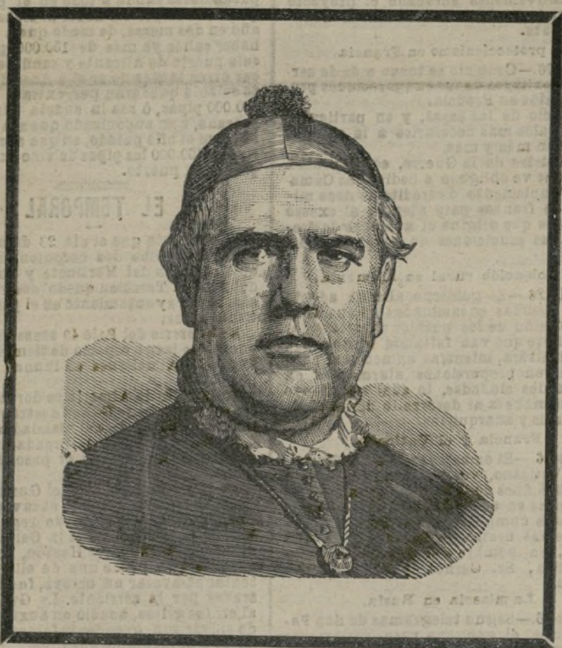
El cardenal Payá y Rico.

también las de sus discípulos Atanasio y Teodoro.