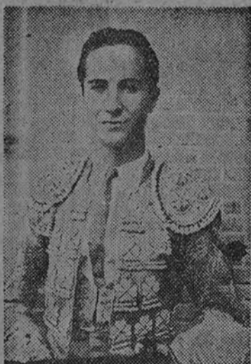
Luis Miguel Dominguín

La primera cogida del año ha ocurrido en Valencia. La ha tomado el cabeza de toro de la primera corrida de las fallas: Luis Miguel Dominguín, el matador en candelero por tantas razones de plaza y de fuera de plaza. Y ha sido importante, por sí misma y porque le quita al juvenil espada cuatro o cinco corridas de esas de entre marzo y abril, que tanto le convienen a los "ases", para "ponerse" pronto.