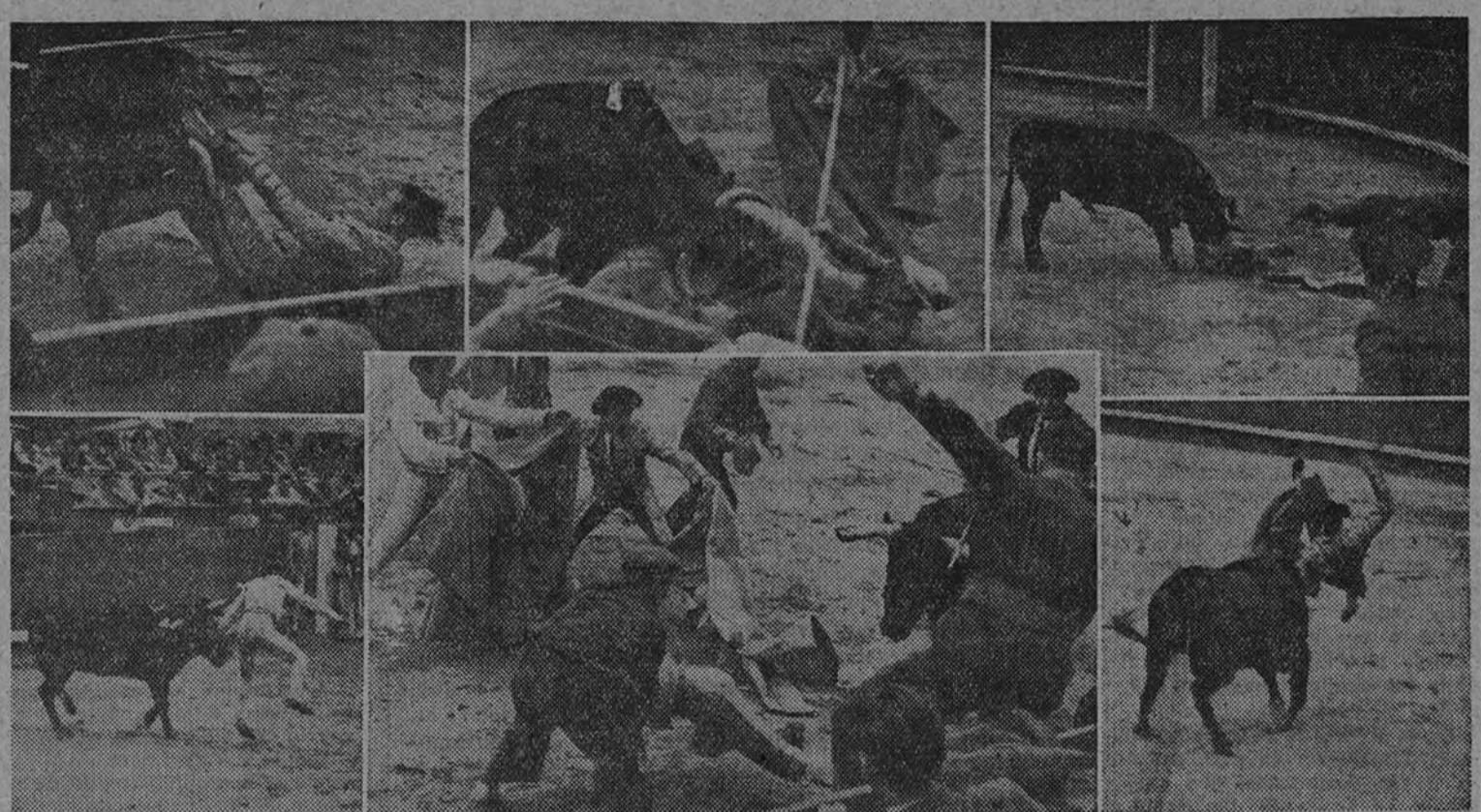
Varios aspectos de la novillada de ayer en Madrid