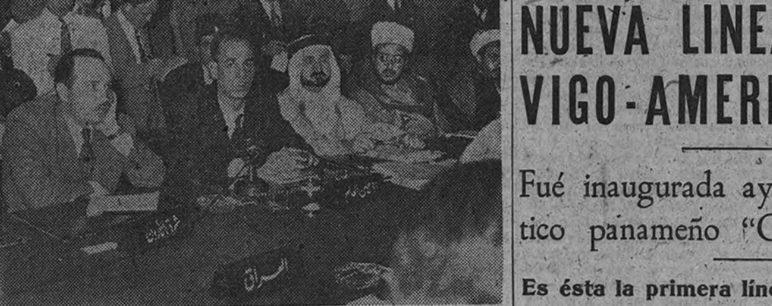
Abdel Rahman, secretario de la Liga Árabe, y los delegados de Transjordania y Arabia Saudita, reunidos en Bludán (Siria), examinando la situación en Palestina.

Unas declaraciones del secretario general, Azzam Pachá, sobre las actividades de la organización