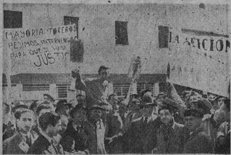
Manolete sale del aeródromo a hombros de los aficionados que fueron a recibirle.

Los aficionados le tributaron un entusiasta recibimiento