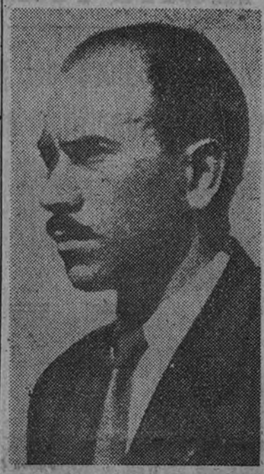
El asesino visto de perfil