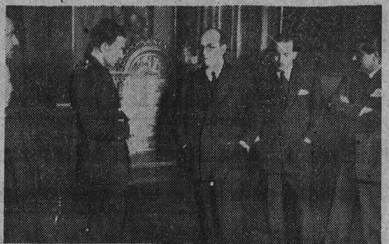
El Alcalde de Santiago hace entrega al Ministro de Educación Nacional, don José Ibáñez Martín, de un artístico pergamino nombrándole hijo adoptivo de dicha ciudad.

Una Comisión de aquel Ayuntamiento, presidida por su Alcalde, entregó al señor Ibáñez Martín el nombramiento