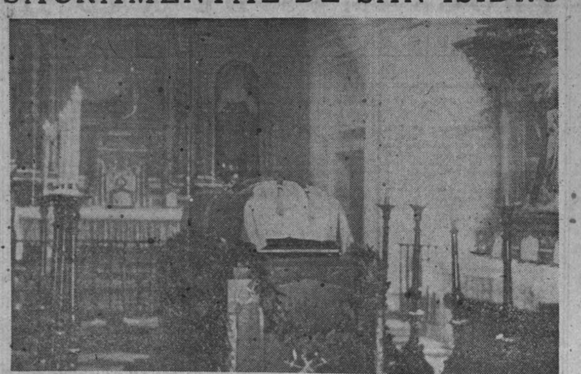
Los restos del glorioso general después de la exhumación, efectuada ayer mañana, en la capilla de la Sacramental de San Isidro, desde donde serán trasladados esta mañana al Ministerio del Ejército, en el que se instalará la capilla ardiente.