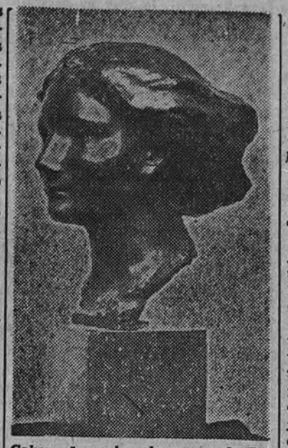
Cabeza de mujer-bronze, de Enrique Casanovas

A José Planes le preocupa con exceso la pueril obsesión de dar a sus esculturas el contraste, la fuc-