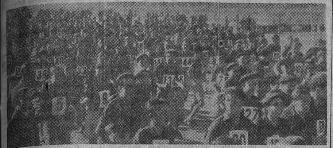
Centenares de muchachos seleccionados de toda España participarán en los Campeonatos nacionales de marcha y campo a través del Frente de Juventudes

Las pruebas tendrán lugar entre los días 30 de marzo al 6 de abril