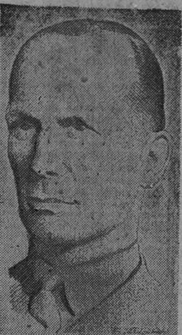
El Rey Jorge de Grecia, que acaba de morir a consecuencia de un ataque cardíaco

ATENAS 1.—El Rey Pablo de Grecia ha dirigido el siguiente mensaje a la nación: «Nos encontramos en lucha por nuestra existencia, nuestra independencia y nuestras libertades. Unidos, llegaremos a un fin victorioso». Elogió después la personalidad del Monarca difunto en los siguientes términos: «Con la conciencia tranquila abandoné mi amado hermano el mundo. No hay sacrifi-