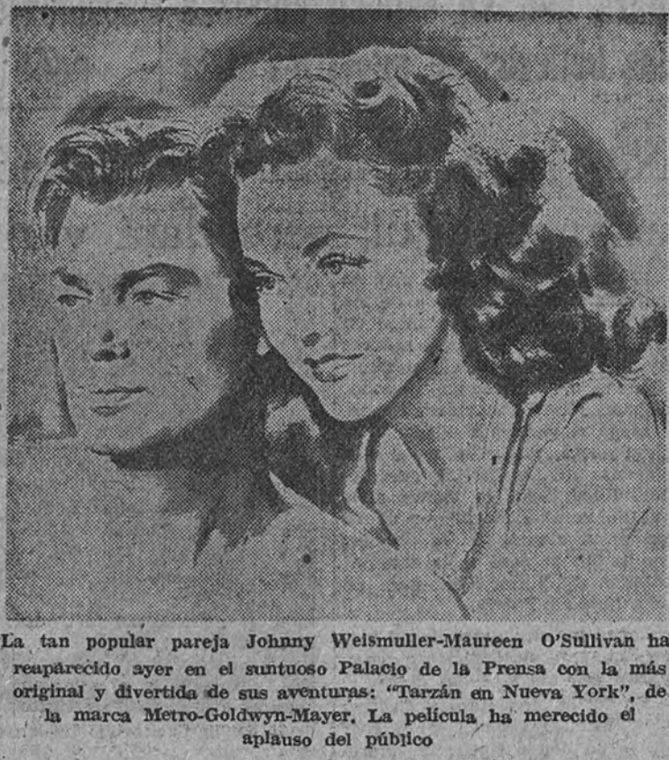
La tan popular pareja Johnny Weismuller-Maureen O'Sullivan ha reaparecido ayer en el suntuoso Palacio de la Prensa con la más original y divertida de sus aventuras: "Tarzán en Nueva York", de la marca Metro-Goldwyn-Mayer. La película ha merecido el aplauso del público