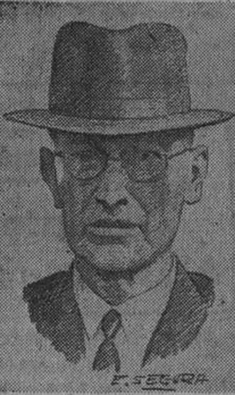
El posible nuevo Kerenski