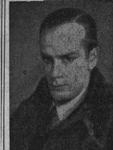
Fragmento de un retrato de Cela, por Mosquera

Pronunció una conferencia Camilo José de Cela