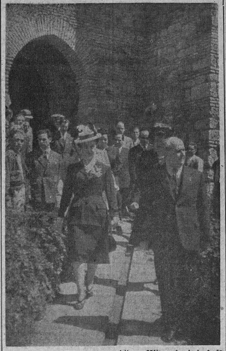
La esposa del Caudillo durante su visita en Málaga al palacio de la Alcazaba.

Ayer visitaron los principales monumentos de la capital