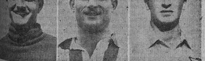
Pera, Riera y Aparicio, el trío defensivo del Atlético de Madrid, tuvo una espléndida actuación en el partido con el Castellón

Es muy probable que antes del partido con el Madrid descanse en Miraflores