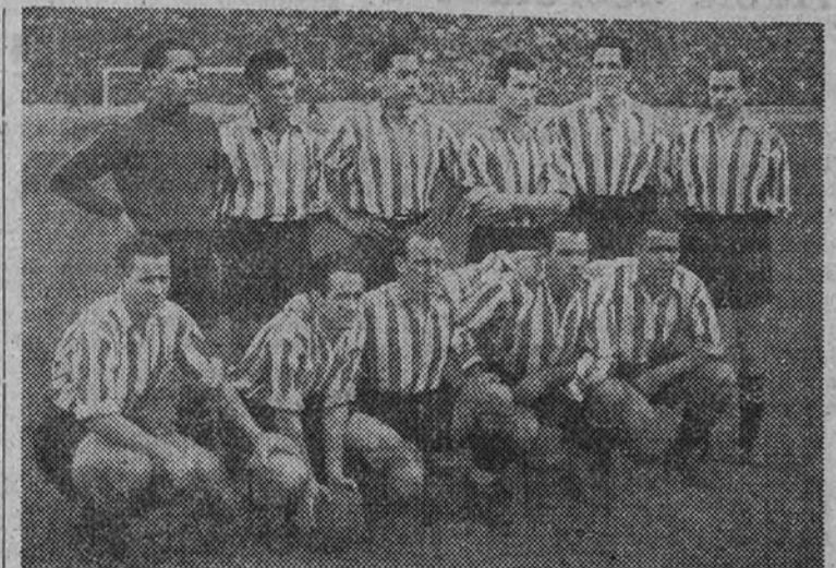
El Atlético de Bilbao es de los tres primeros que cuenta con más probabilidades de ganar la Liga, debido a que su rival es el Coruña y a que lleva un punto de ventaja