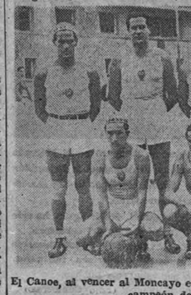
El Canoe, al vencer al Moncayo en la final de Segunda División, queda campeón de esta categoría

ARCHIBALD El Canoe, al vencer al Moncayo en la final de Segunda División, queda campeón de esta categoría