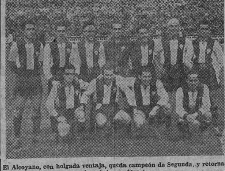
El Alcoyano, con holgada ventaja, queda campeón de Segunda, y retorna a la máxima categoría

RESULTADOS Baracaldo, 2; Ferrol, 3. Real Sociedad, 2; Mallorca, 1. Zaragoza, 3; Hércules, 0. Santander, 4; Betis, 1. Gimnástico, 3; Córdoba, 0. Alcoyano, 4; Levante, 2. Granada, 4; Málaga, 2.