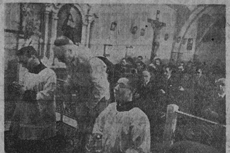
El obispo de Gibraltar celebrando la santa misa en la capilla de Nuestra Señora del Sagrado Corazón el pasado domingo

Oficiaron el Nuncio de Su Santidad, el Patriarca de las Indias y el arzobispo de Zaragoza