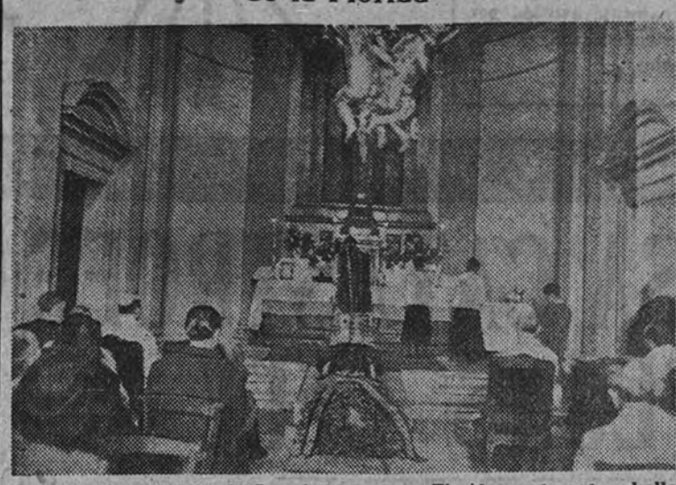
Aspecto de la ermita de San Antonio de la Florida, en la que se halla la tumba de don Francisco de Goya, durante la misa organizada por la Real Academia de San Fernando en memoria del inmortal pintor.

Se celebraron en la ermita de San Antonio de la Florida