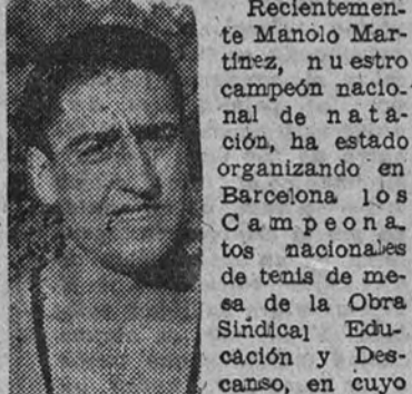
Manolo Martínez, campeón nacional de natación