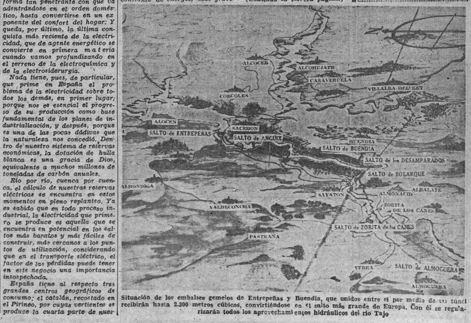
Situación de los embalses gemelos de Entrerpeñas y Buendía, que unidos entre sí por medio de un túnel recibirán hasta 2.300 metros cúbicos, convirtiéndose en el salto más grande de Europa. Con él se regularizarán todos los aprovechamientos hidráulicos del río Tago.