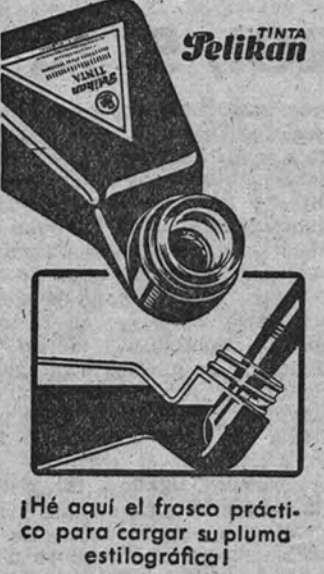
¡He aquí el frasco práctico para cargar su pluma estilográfica!