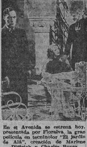
En el Avenida se estrenó hoy, presentada por Floravia, la gran película en technicolor "El jardín de Alá", creación de Marlene Dietrich y Charles Boyer