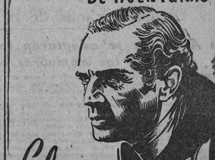
Pierre Richard Willm, Michele Alfa y Ermete Zacconi en "El prisionero del castillo de If"