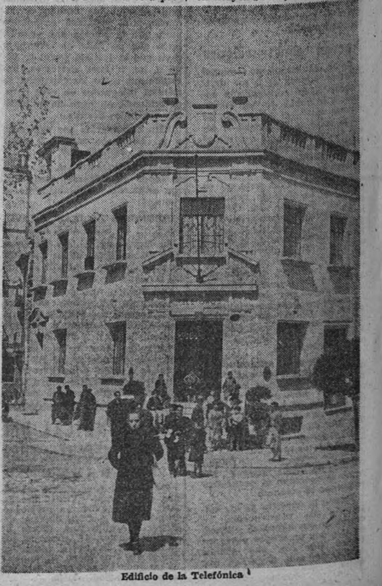
Edificio de la Telefónica