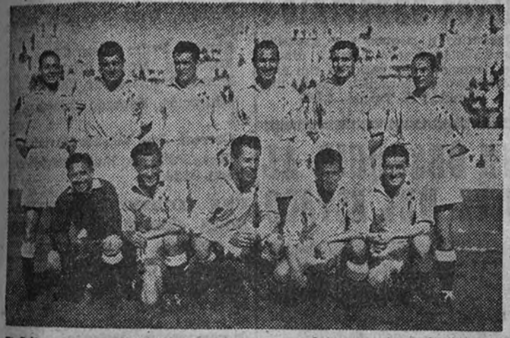
El Celta, que en el partido de Liga que quedaba pendiente logró batir por primera vez en la segunda vuelta al Sabadell