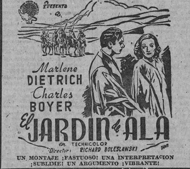
Marlene Dietrich y Charles Boyer en "El jardín de Alá"