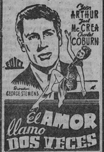
Jean Arthur, la encantadora estrella del cine yanqui. Próximamente podremos admirarla en "El amor dos veces", comedia llena de optimismo y alegría, que presentará Edici. Junto a Jean Arthur actúan Joel MacCrea y Charles Coburn

Si ha tenido usted el pensamiento de ceder la mitad de su piso, no lo haga hasta ver lo que ocurrió a la más linda rubia de la pantalla por hacer tal cosa