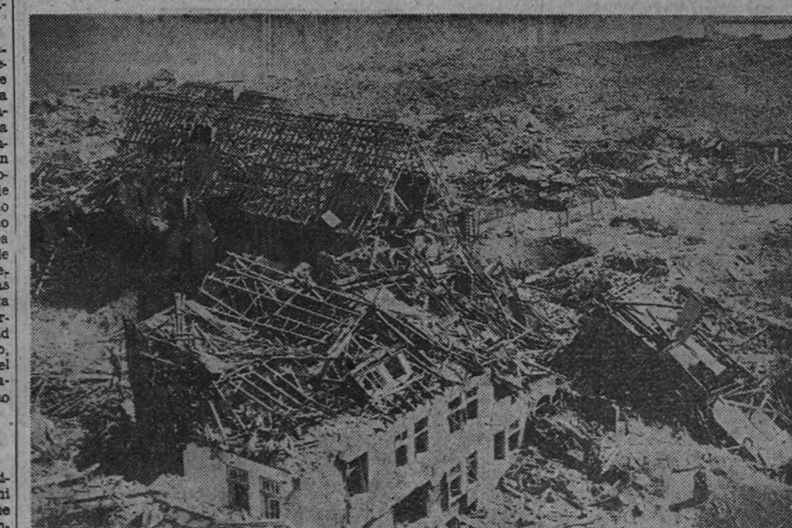
Así queda una vista de la isla de Heligoland después de la voladura de todas sus magníficas fortificaciones