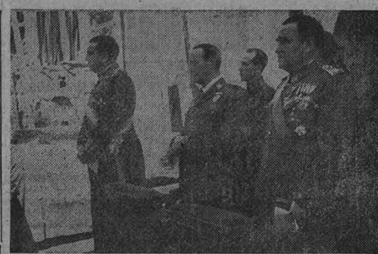
El Ministro de Asuntos Exteriores, en la presidencia del acto

Viejos caminos de peregrinar tiene España. Viejos pero fragantes y renovados cuando se trata de "Ir a María", aspiración española tan acentuada y recia que el capitán Iñigo de Loyola "fue a María" en Montserrat. Voces del "Virrolat" y largas caminatas han encendido el fervor de las jornadas de la dura montaña, que, vivificada, ha entonado una Salve clamorosa. España, unida, canta a la Virgen y pide de responder con limpia humildad a la pregunta ritual: "¿Quién es tú y qué quieres?" Somos el pueblo asuncionista, pueblo de Concilios y Cruzadas; queremos la paz, pero no una paz acomodada, sino la paz heroica de los que peregrinan.