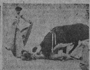
Cogida de Albalán

El caso de Aguado de Castro es también de limitación, o de limitaciones evidentes. Fue un toro de servicio, que vino muy largo, y que toreó, pero torable, que se le quedó también sin torar. Si lo torar a fondo, digo, porque echale color a los dos, e incluso voluntad de torar—y hasta va'lación de toros—, es más o menos «chabladito», es lo que suponen los que piensan que es sólo torero de clase. Deficientísimo malando y capeando de alegrías, a duras penas disimula con la muleta sus cojeras. En conjunto, Albalán—tranquilo y respaldado, hábil y metido—, no entra ni llega al calor: parece presente y ausente—torado—en el tercio, nostálgico de un clima cuya ausencia le abruma, y que acaso las plazas no pueden dar jamás. En el puyecto de «corrida del toro», «decepcionado», no hubiera encontrado a ninguno como el primero de su lote: el «Clavell».