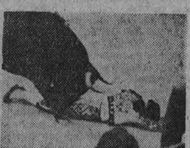
Cogida de Barra