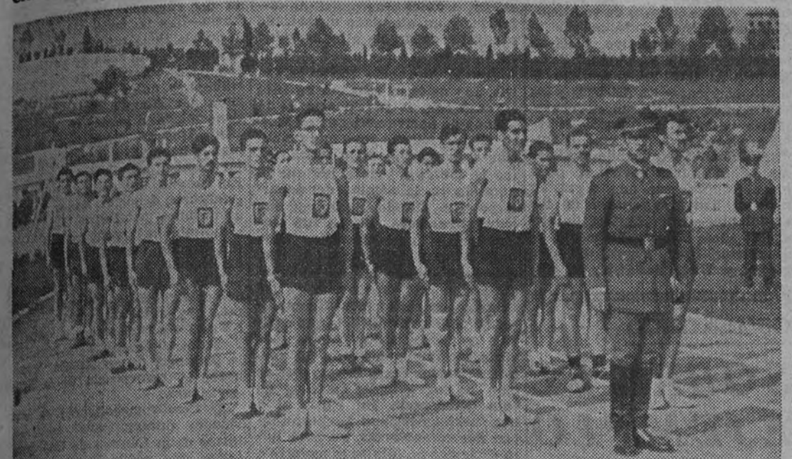
Equipo del Batallón de Infantería del Ministerio del Ejército, clasificado en primer lugar en los Campeonatos de atletismo de la primera región militar, celebrados en la Ciudad Universitaria.

El Batallón del Ministerio del Ejército tuvo una brillante actuación en todas las pruebas