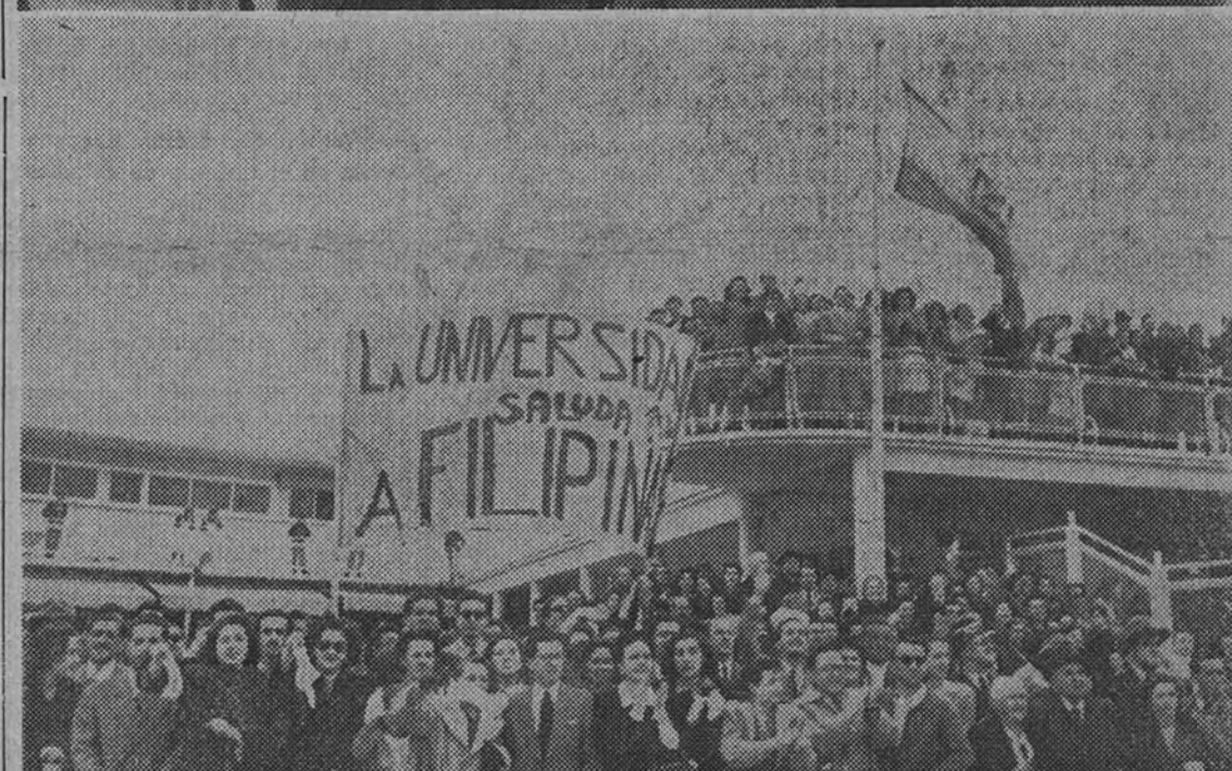
Momento de tomar tierra en Barajas el aparato filipino, y el público vitoreando y aplaudiendo entusiastamente a los viajeros del país hermano

que apenas han dejado de mirarse sino el tiempo preciso para encontrarse en sí mismos. En el tiempo han coincidido con precisión asombrosa la configuración independiente, llena de honor y sangre bien reciente, de la nación filipina y el resurgimiento español nacido del Movimiento Nacional y del que es prenda y garantía nuestro Caudillo. El abrazo entre España y Filipinas no podía tardar, y así ha llegado doblemente, a través de cinco mares en la proa del "Haleakala", y por encima de dos continentes, sobre las alas del "N. C. 048" que acaba de llegar en la mañana de ayer. Abrazo por encima de todas las tempestades que agitan al mundo y que han roto o furiosamente—instintivamente—contra el acantilado español. Impuesto por la antigua maternidad hispánica del descubrimiento, por la comunidad de la fe en Cristo que llevaron agustinos, franciscanos, jesuitas y dominicos españoles, por la identidad de un idioma y de una civilización adelantada en el orbe oceánico. Y por las mil cosas menos rotundas que sirven para clavar a perpetuidad los amores; por ese nombre de la Ibabla, bello como un ensueño, por los vuelos españoles y filipinos en la etapa precedente y heroica de la aviación, por las armas que los nobles patriotas filipinos presentaron a los héroes de Balor o por esa tela de nipa