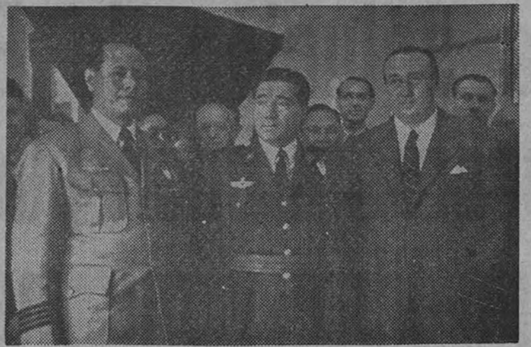
El Ministro del Aire y el coronel Arnáiz durante el acto celebrado en su despacho del Ministerio, en que el general Gallarza impuso la Cruz del Mérito Civil al héroe filipino.

Asistieron al acto personalidades españolas y filipinas