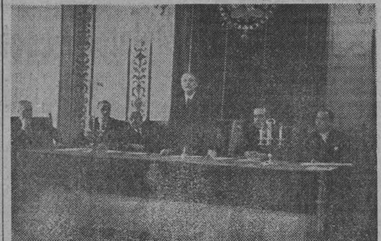
El Ministro de Justicia, señor Fernández Cuesta, pronunciando el discurso de clausura de la Asamblea Nacional de Protección de Menores.

«La legislación de menores españoles es de las más adelantadas del mundo»