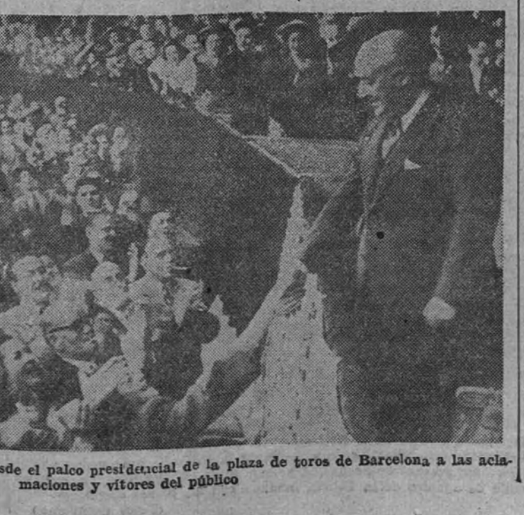
El Caudillo corresponde sonriente desde el palco presidencial de la plaza de toros de Barcelona a las aclamaciones y vítores del público