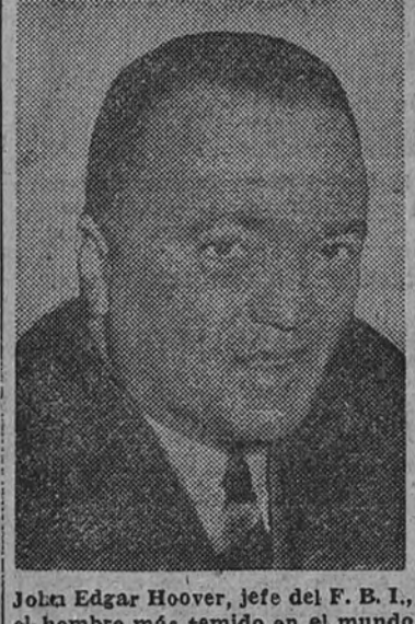
John Edgar Hoover, jefe de la F. B. I., el hombre más temido en el mundo para los agentes rojos

Es poderosísima la “quinta columna” comunista en los Estados Unidos.—Así lo asegura Edgar Hoover, director de la famosa F. B. I., institución que llaman los agentes rojos “la Gestapo democrática”.—Inspira William Foster, jefe de los comunistas yanquis, las actuales huelgas?