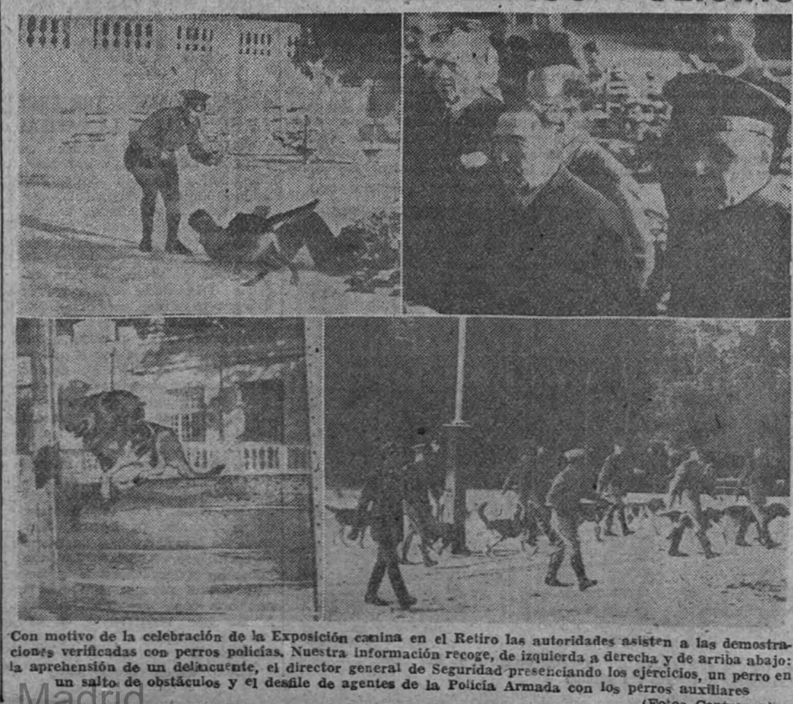
Con motivo de la celebración de la Exposición canina en el Retiro las autoridades asisten a las demostraciones verificadas con perros policia.