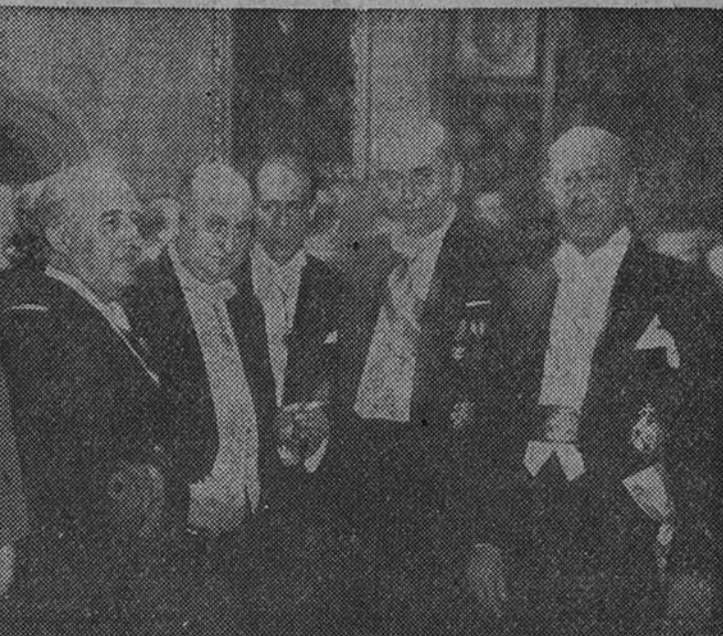
Su Excelencia el Jefe del Estado durante la recepción celebrada en su honor en el Monasterio de Montserrat. Acompañado al Generalísimo el Presidente de la Diputación, el Alcalde y otras altas personalidades

ción desgarradora de la leyenda y del mito, hacen precisamente esos insalvables paroxismos de adhesión, de simpatía y de cariño. Pero hoy Manresa era, además de un ámbito fabril, superlativamente egregia en la industria catalana, una ciudad cargada de historia y de tradición, una ciudad con prestigio de santos y de héroes. Cuando la comitiva, precedida de los clásicos heraldos a caballo, se dirigía a la maravilla arquitectónica de Santa María de la Seo, todo un pasado de grandeza y de protocolo señorial, quiero decir natural; por lo tanto, sin ajer de guardarrapia teatral, ponía en los circunstantes la evocación de los mejores tiempos del Principado catalán, conspicuo entre los