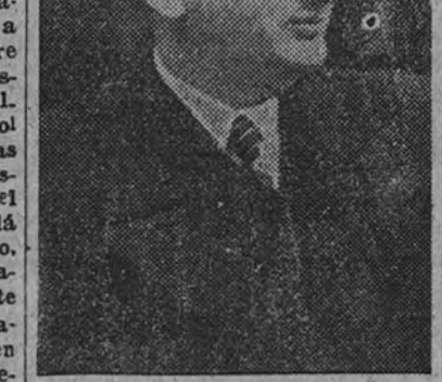
José Luis de Arrese

y feliz persistencia—más o menos estruendosa—del falangismo en las horas más graves de la defensa española. Repasada una hora, un minuto, cualquiera de esas defensas defendida y sorda y verás siempre como un falangista llegó a tiempo de situarse en la primera y más descubierta brecha. Como el mundo de la política, igual que el de la filosofía, tiene su realidad tejida de contrarios, muchos no han percibido de bulto hasta qué punto las ideas y limitadas tradiciones supranan la existencia de una ferrozosa, extensa e inquebrantable lealtad.