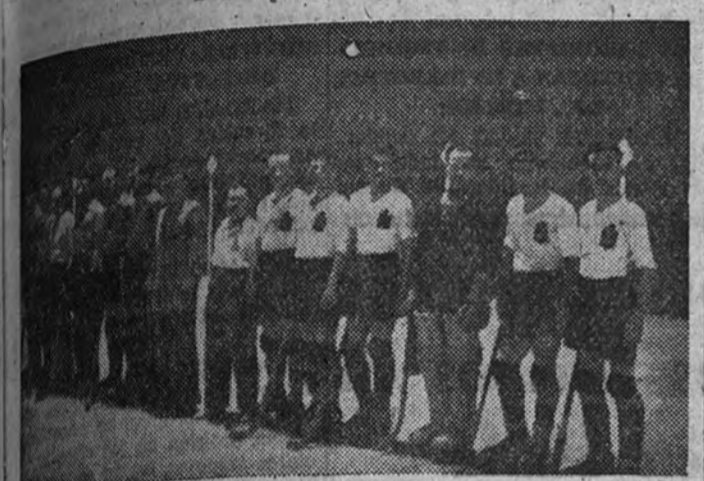
Los equipos belga y español antes de dar comienzo el encuentro

La exhibición de los campeones de patinaje artístico resultó maravillosa