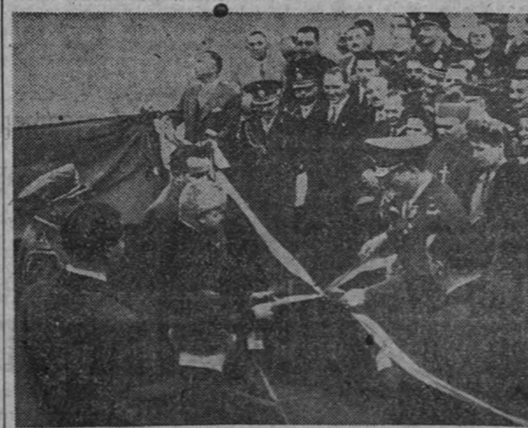
Los Presidentes Perón y Dutra se encuentran en la frontera argentino-brasileña para cortar la cinta que inaugura el puente de Paso de los Libres, que une a los dos países vecinos.

ALEGRE COMPAÑIA ALBAJAS, OBJETOS DE ORO Y PLATA "PASEO DE MIRA, 3. ENVIÓ. TELEF. 22.45.50"