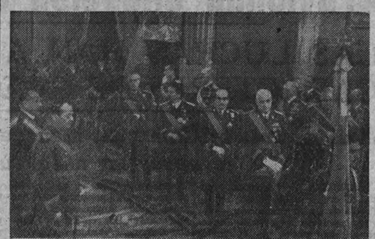
El Ministro de Obras Públicas, con otras personalidades, presidiendo la solemnidad religiosa celebrada ayer mañana en los Jerónimos por el Arma de Ingenieros en honor de su Patrón, San Jerónimo

El Ministro de Obras Públicas presidió la solemnidad religiosa celebrada en San Jerónimo