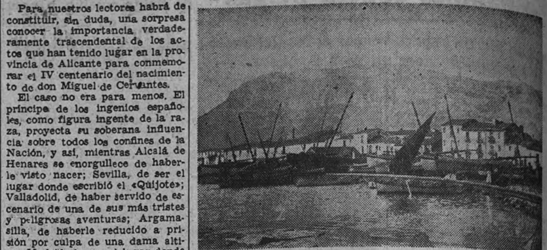
En este rincón del puerto de Denia desembarcó Cervantes en 1581, tras la batalla de Lepanto y su largo cautiverio en Argel

Los expedicionarios, presididos por el almirante Bastarache, se trasladaron desde Alicante en un buque de guerra