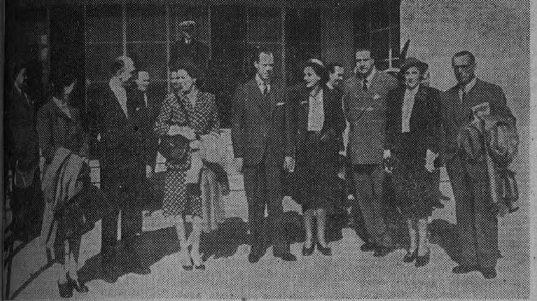
El ministro de Asuntos Exteriores, señor Martín Artajo, con el propósito de una visita directa a las islas canarias, se encuentra en Villa Cisneros, donde se encuentra con doña Eva Duarte de Perón.

(CRONICA DE NUESTRO ENVIADO ESPECIAL J. A. TORREBLANCA.)