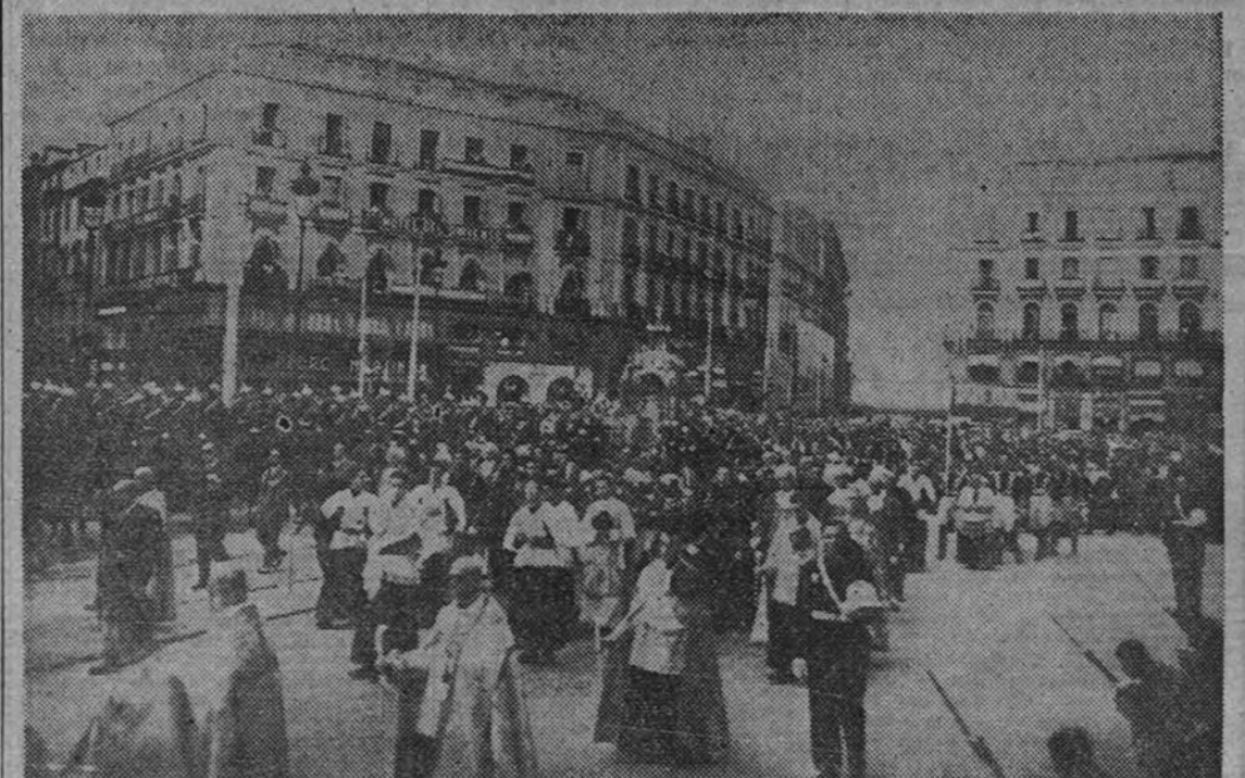
La procesión del Corpus a su paso por la Puerta del Sol. (Información en segunda página.)