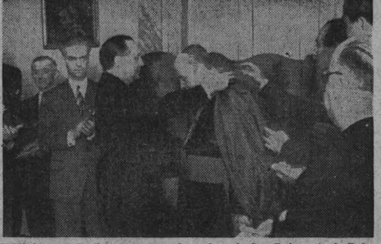
El Ministro de Justicia impone la Gran Cruz de San Raimundo de Peñafort al obispo de Vitoria.

Las insignias han sido costeadas por los Gobernadores Civiles de las provincias vascongadas