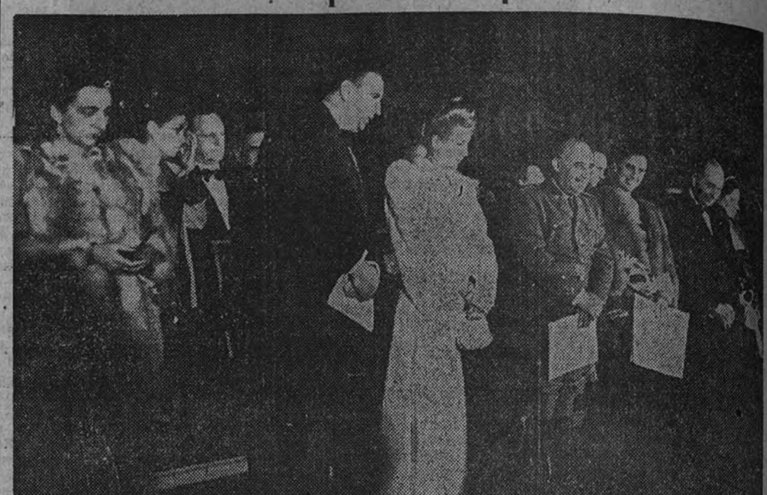
El Caudillo, la esposa del Presidente Perón, doña Carmen Polo de Franco y otras personalidades presenciando el espectáculo de la plaza Mayor

Le fueron ofrecidos a doña Eva Duarte trajes típicos de todas las provincias españolas