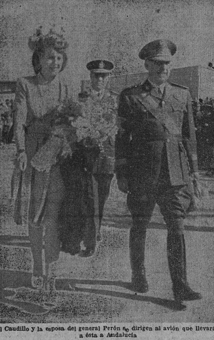
El Caudillo y la esposa del general Perón se dirigen al avión que llevará a ésta a Andalucía

SEVILLA 16. (Por teléfono.) — De aquella edad en que los hombres somos un poco la América de nosotros mismos, recordaba anoche un verso escrito en la yseria árabe del patio de la acedega del Generalife: "Entra con compostura, habla con ciencia, sé parco en decir y sal en paz." También allí donde la cruz puso a la poesía de la suprema verdad, está escrito en yeso que nunca perece: "Solo Dios es vencedor", algo más antiguo que el "Llegué, vi y venció Dios" de nuestro Emperador Don Carlos en Muhlberg. Bajo estas últimas inspiraciones que cimentan la honda aristocracia de Granada, descendió del cielo doña María Eva Duarte de Perón en la tarde de ayer. Granada estaba toda ella a lo largo de las torres de sus ríos urbanos bien "incensada"; júbilo y solemnidad. A lo largo de la carrera de las Angustias, la señora, que había rezado una salva solemne en la basílica donde la Virgen María lleva sobre su manto tantas estrellas de oro como alfileres provisionales muertos en nuestra guerra, iba contentando el asombro como se contiene la respiración. La Granada de velo y mantilla, la artesana, la que jinge bailar en las cuevas y luego se pasa su vida tejendo en el taller y cavando remolacho, cubría la ciudad entera con uno de los movimientos populares de expectación más caudalosos y más nobles que España ha brindado a la primera dama argentina.