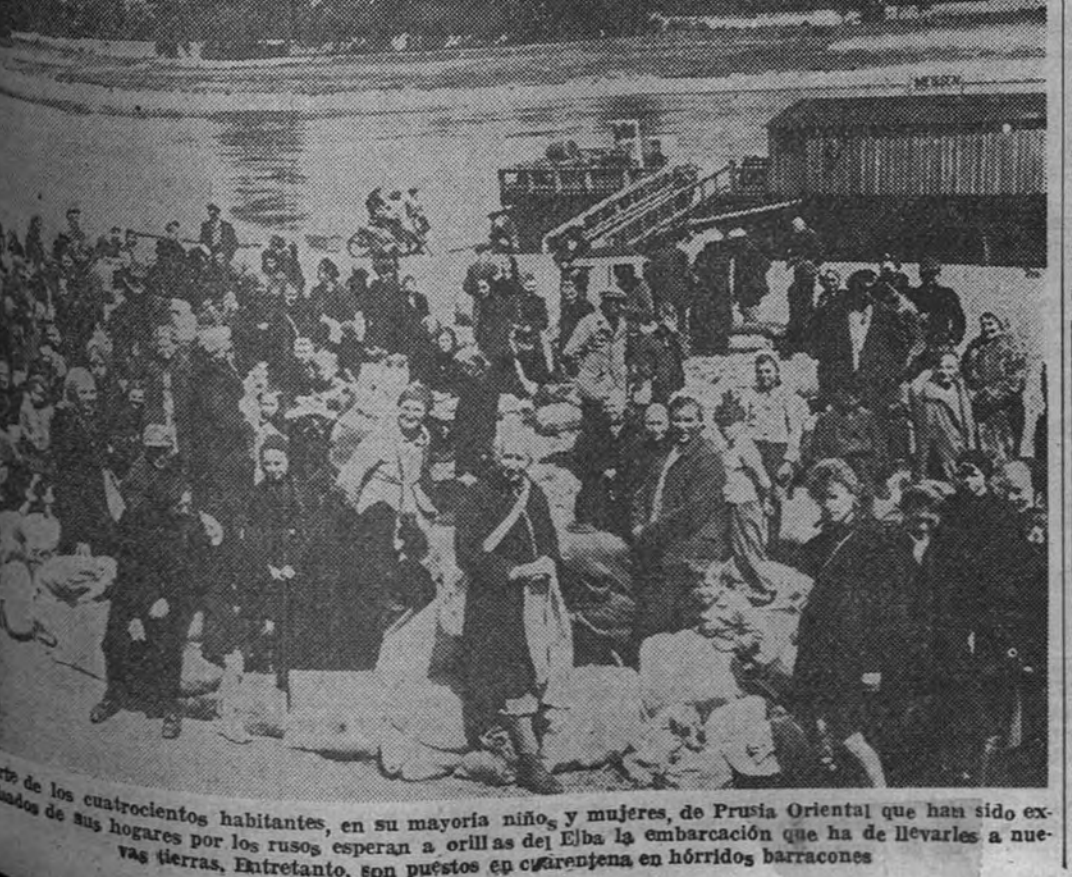
Prado de los cuatrocientos habitantes, en su mayoría niños, y mujeres, de Prusia Oriental que han sido exiliados de sus hogares por los rusos, esperan a orillas del Elba la embarcación que ha de llevarlos a nuevas tierras. Entretanto, son puestos en cuarentena en horribles barracones