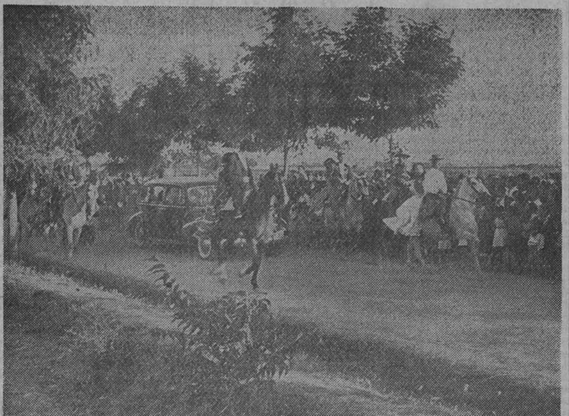
La esposa del Presidente argentino llega escoltada por un cortejo de caballistas, con bellas muchachas a la grupa a la finca Torre-Pava, donde los campesinos le hicieron objeto de un homenaje de cariño y adhesión

Huelva tributó a la esposa del Presidente argentino un gran recibimiento (CRONICA DE NUESTRO ENVIADO ESPECIAL J. A. TORREBLANCA.)