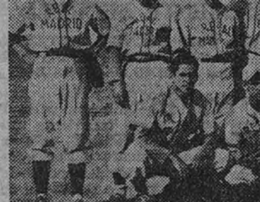
El equipo del Real Madrid, actual campeón regional, que el domingo tendrá un difícil rival en la novena de los Piratas.

La prueba será una carrera de 24 horas, que se celebrará en el estadio de Vallecas, que es uno de los mejores lugares para ver una carrera de ciclismo de fondo.