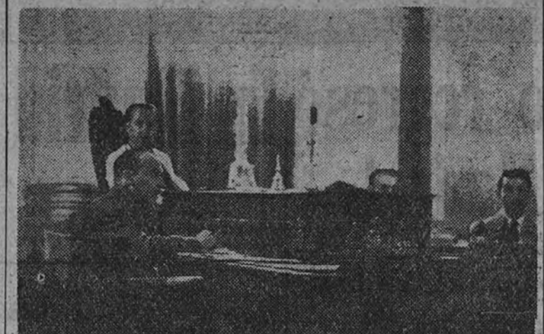
El Delegado Nacional de Sindicatos presidiendo la clausura de la Asamblea Nacional de Detallistas de Ultramarinos, celebrada ayer tarde.