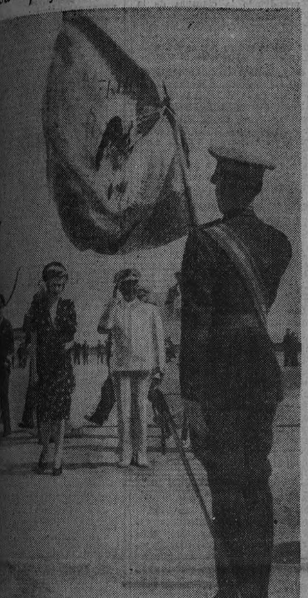
Caudillo y la esposa del general Perón saludando a la bandera española en el aeropuerto del Prat momentos antes de tomar el avión. Durante el viaje que había de conducirle a Roma

El viaje en avión, acompañado de su hija y del Ministro del Aire