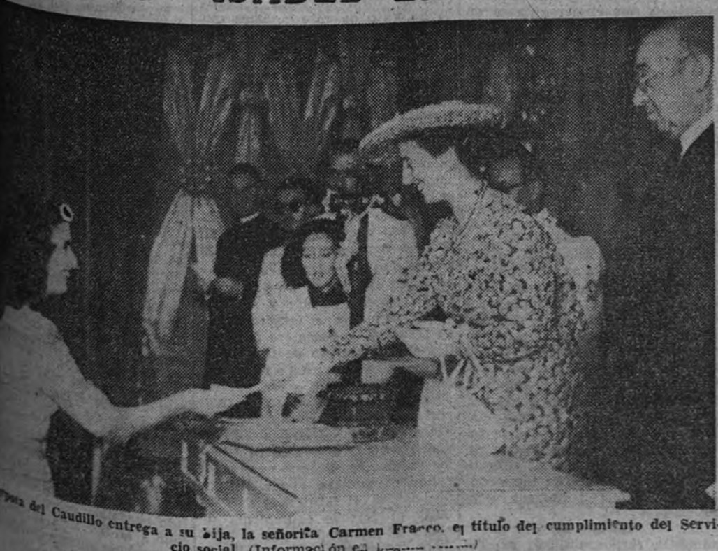
El Caudillo entrega a su hija, la señorita Carmen Franco, el título del cumplimiento del Servicio social. (Información en la página 40)