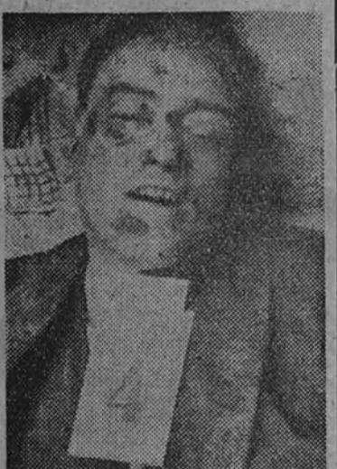
Reverendo Padre Gato