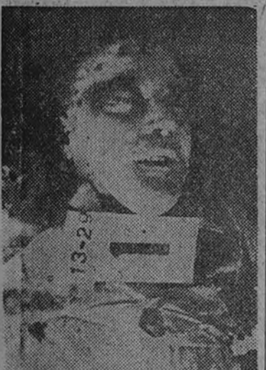
Conde de Santa Engracia