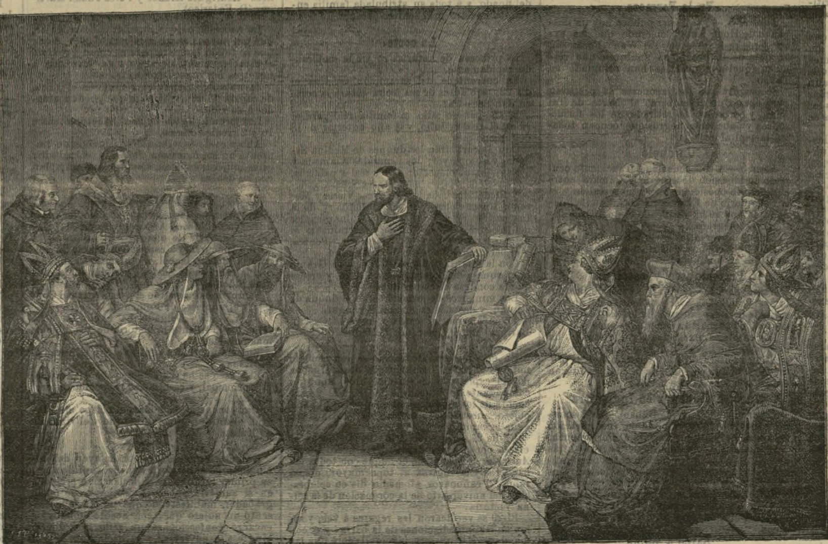
JUAN HUSS ANTE EL CONCILIO DE CONSTANZA

le es oír, sino también el de escribir, y el de leer».