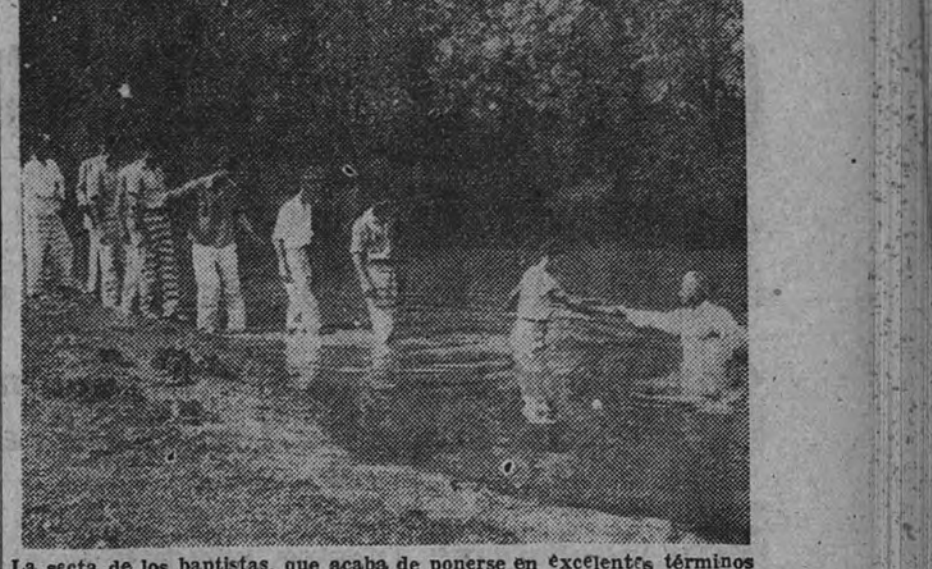
La secta de los baptistas, que acaba de ponerse en excelentes términos con Moscú, se dedica con preferencia a ganar prosélitos entre los penitenciarios. He aquí un bautismo en una colonia penal.

(Viene de primera página.) Los de credo. Los diarios yanquis creen en su mayoría, que Newton es víctima de su propia «santa simplicidad»; pero hay quien ve en esta campaña y en los repentinos amores de Stalin por los baptistas algo más peligroso, recordando que durante la revolución comunista, Lenin se sirvió de los dos millones de baptistas rusos para minar la Iglesia de Oriente, lo que consiguió plenamente.