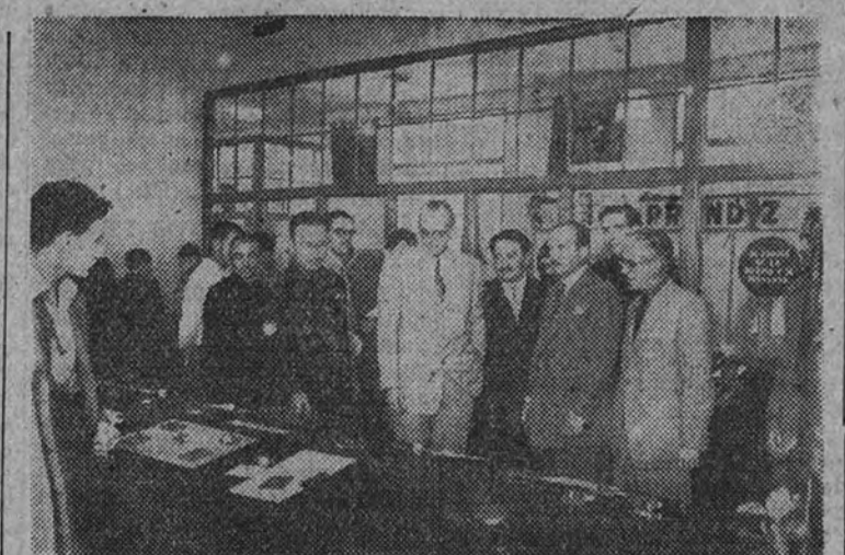
El Gobernador Civil y Jefe Provincial del Movimiento, con el jefe del Parque Móvil de los Ministerios, el jefe del Distrito Universitario y otras personalidades, inauguran la Exposición provincial de Formación Profesional del Frente de Juventudes.