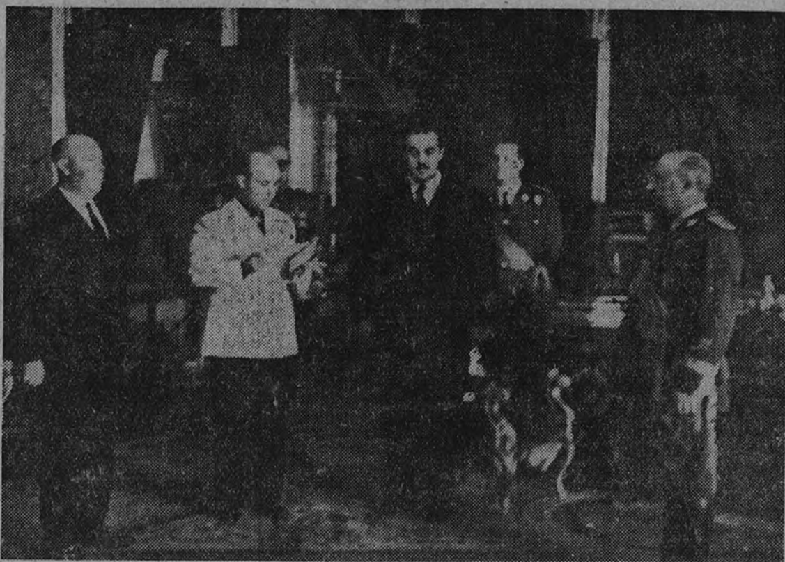
El Caudillo, acompañado de los Ministros de Trabajo y Gobernación, preside la entrega de los títulos de Empresas y productores ejemplares, en su residencia de El Pardo

A petición, que redobló vuestro esfuerzo, lo hago en nombre de los que cayeron y del Ministerio señor Girón, ese hombre, que ha de dar de ser jefe, una