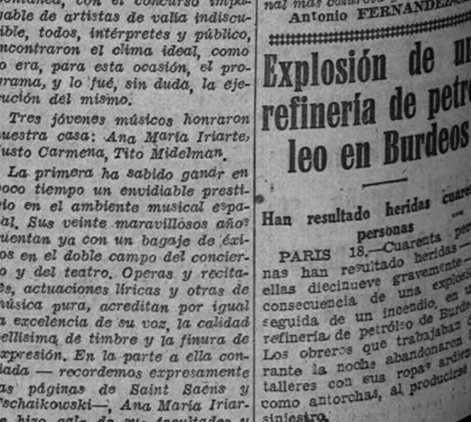
Explosión de la refinería de petróleo en Burdeos

PARIS 18.—Cuarenta personas han resultado heridas —ellas diecinueve gravemente— consecuencia de una explosión seguida de un incendio, en la refinería de petróleo de Burdeos. Los obreros que trabajaban durante la noche abandonaron los talleres con sus ropas ardiendo como antorchas, al producirse el siniestro.