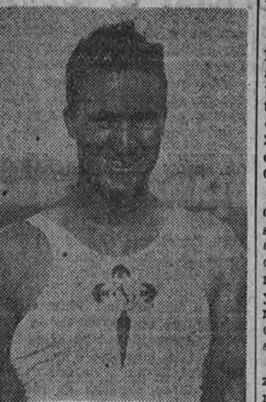
El gran atleta gallego Celso Mariño, actual campeón de España de decatlon