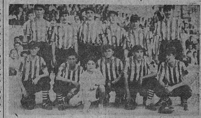
El equipo del Atlético de Madrid, que esta tarde volverá a enfrentarse con su clásico rival el Real Madrid, en partido del Campeonato regional

Esta tarde, en el campo de Vallecas, puede quedar virtualmente adjudicado el título de campeón regional de pelota base de primera categoría. Para que así sea no hace falta más que el Real Madrid vuelva a vencer al Atlético de Madrid, como ya le derrotó el pasado domingo en el Metropolitano.