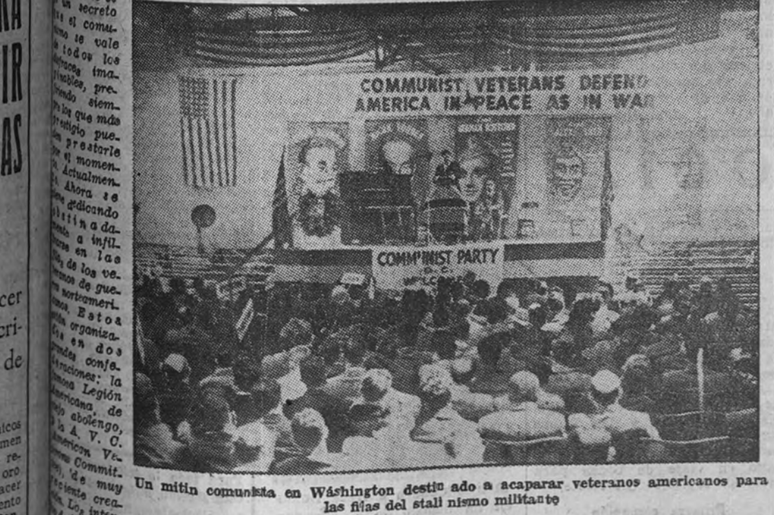
Un mitin comunista en Washington destinado a acaparar veteranos americanos para las filas del stalinismo militante

Aborta en Norteamérica un plan comunista de coacción parlamentaria.—El bolchevismo intenta explotar en vano el prestigio de los veteranos de guerra.—La valentía de un senador obliga a los rojos a retirarse “como canes castigados”